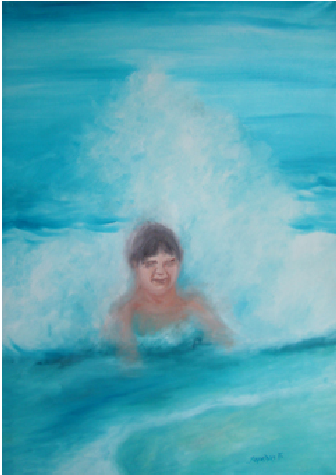
«Σιγά μην πνιγεί - Πήλιο », Λάδια 70cm X 100cm