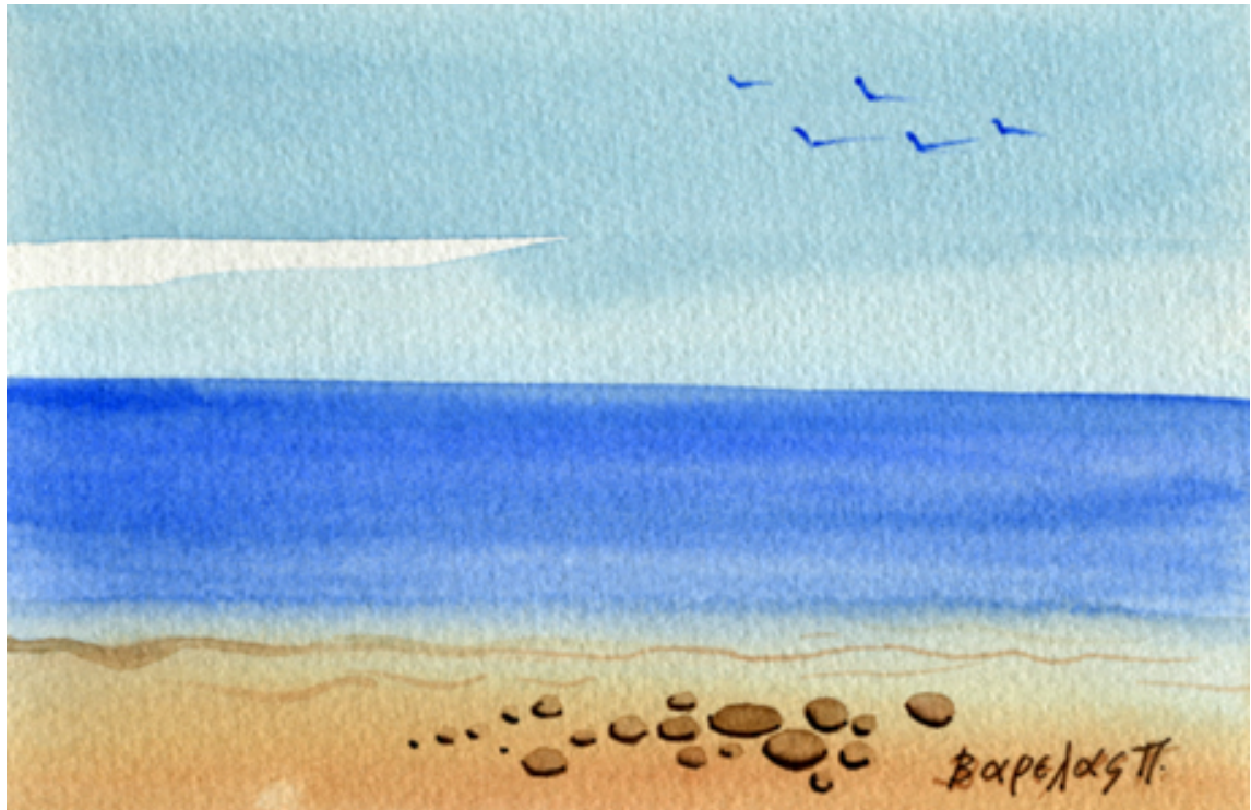
«Αγαθούπολη ΠερίαςIII», Ακουαρέλα, 12cm X 16cm