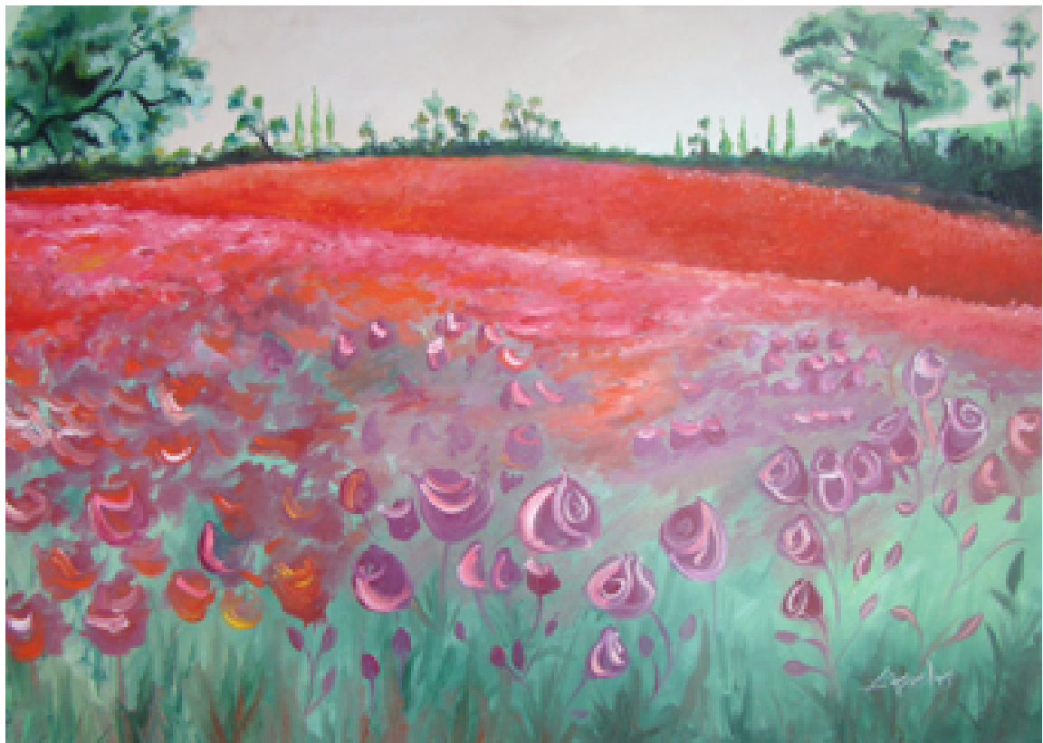
«Παπαρούνες» , Λάδια 70cm X 100cm