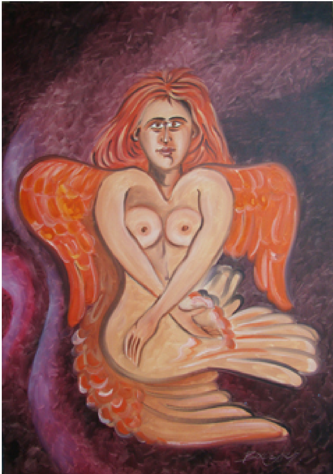
«Χερουβείμ σύναξης VI» Λάδια, 70cm X100cm