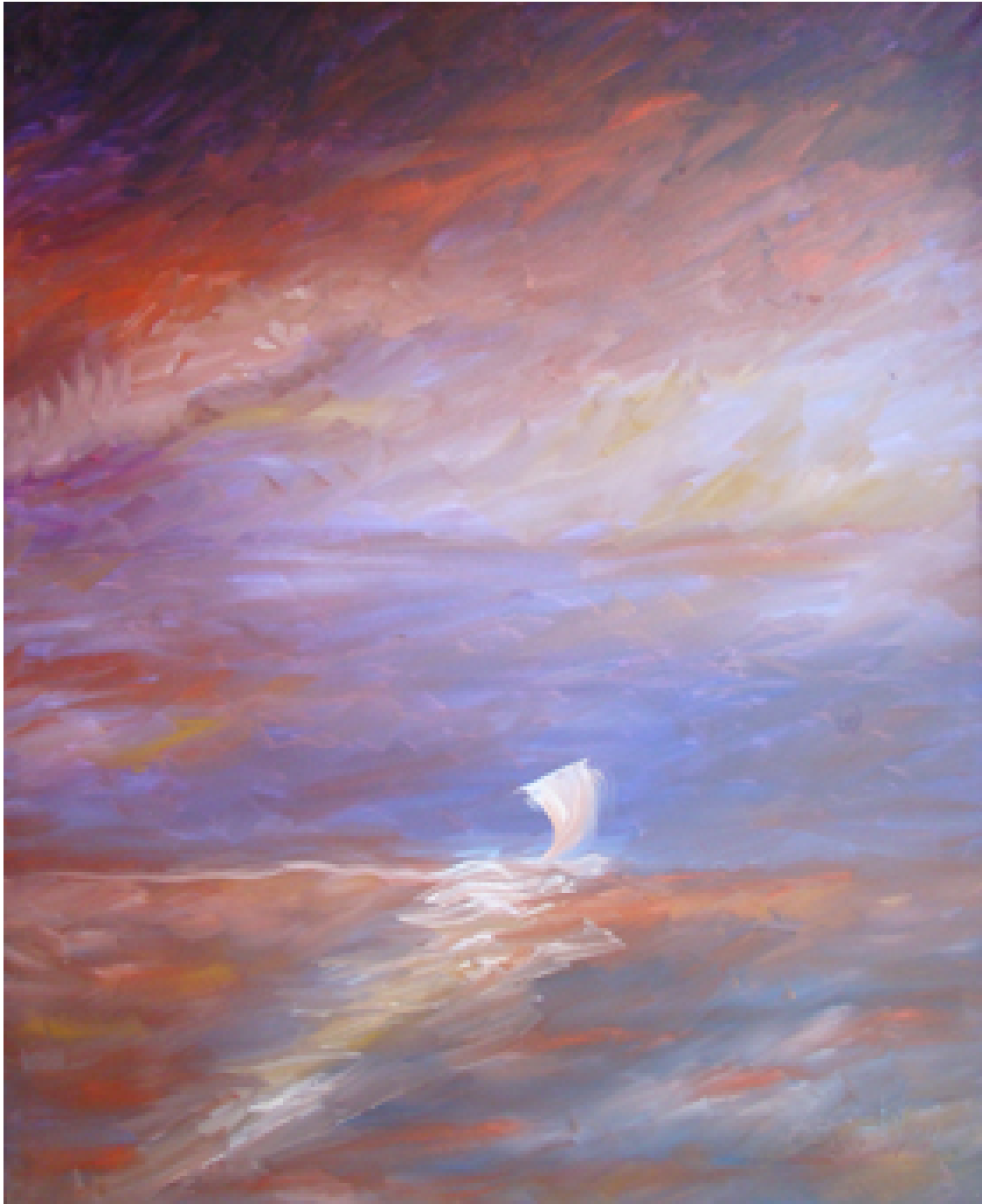
«Κόκκινη αδρεναλίνη», Λάδια 100cm X 120cm