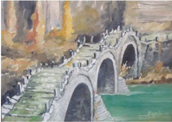
«Τσεπέλοβο - Ζαγόρι » , Λάδια 20cm X 40cm