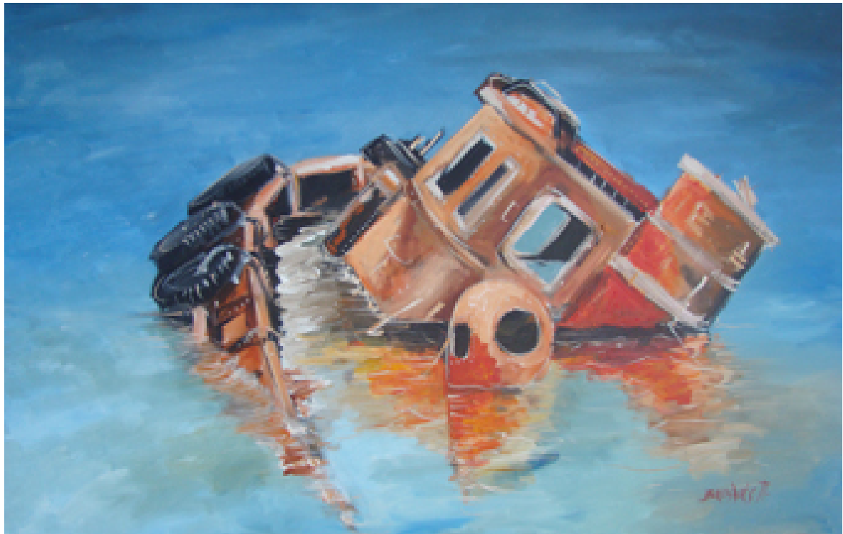
«Ναυάγιο» , Λάδια 70cm X 100cm