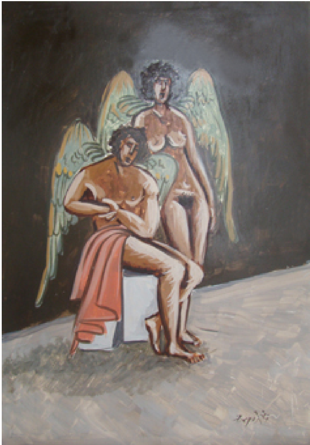
«Χερουβείμ σύναξης V» Τέμπερα, 35cm X50cm