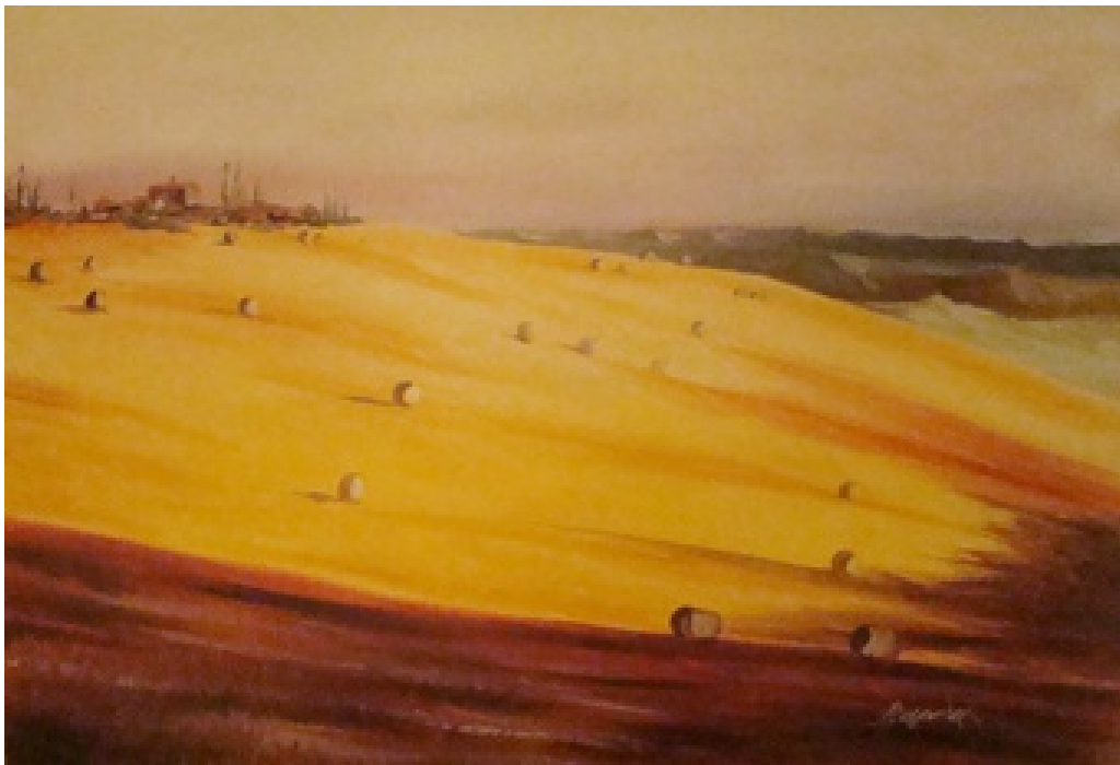
«Τοσκάνη III», Λάδια, 70cm X 100cm