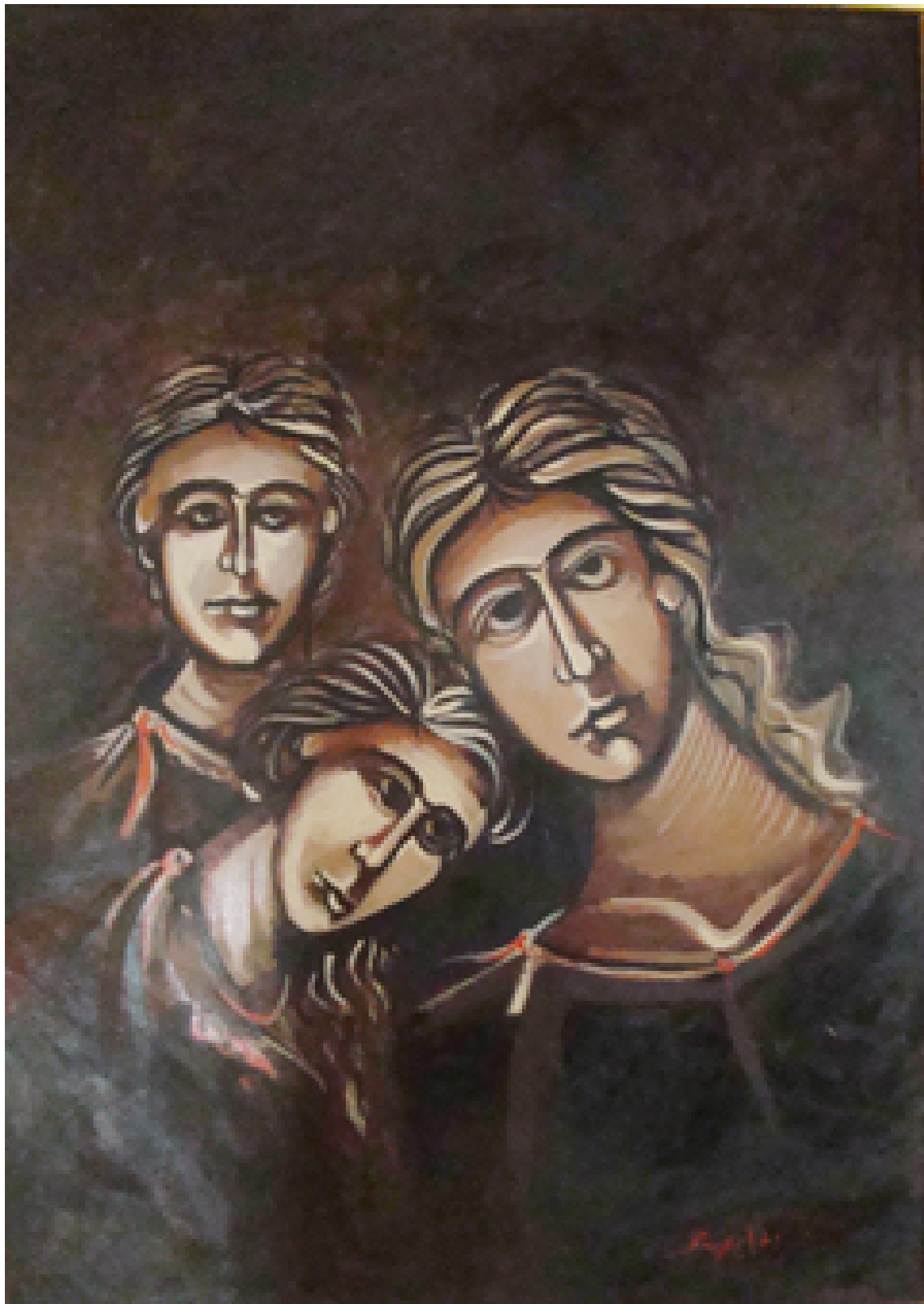
«Γυναίκες», Ακρυλικό, 70cm X 100cm