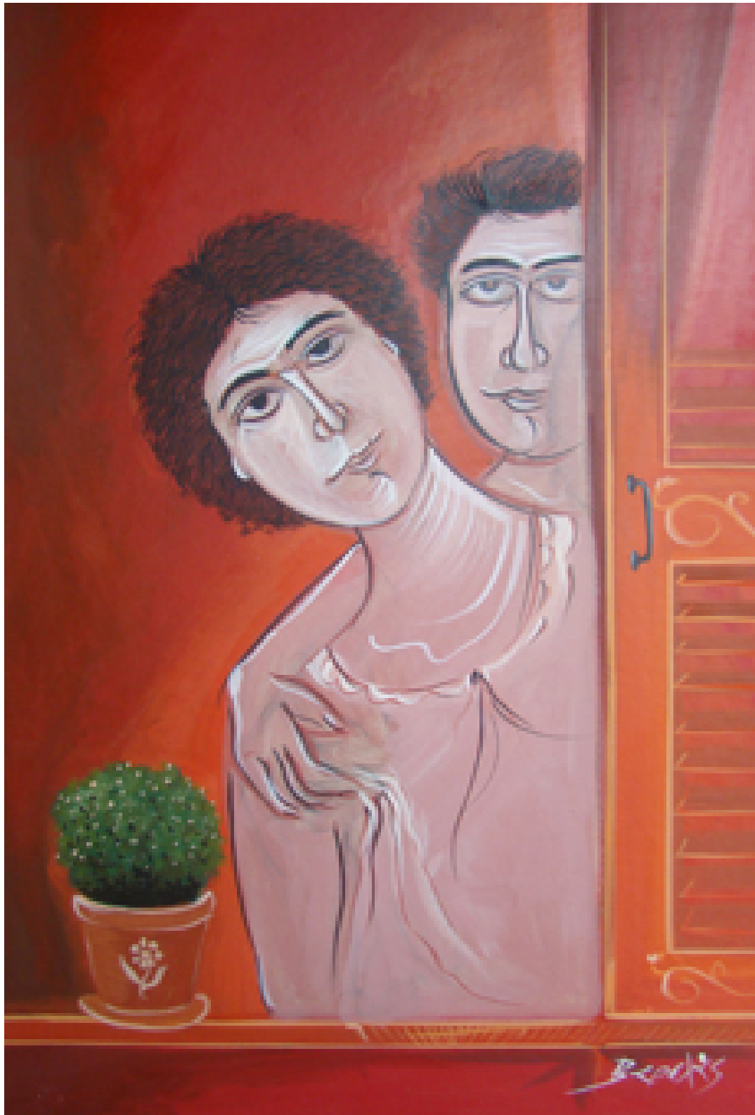
«Βασιλικός και αγάπες», Ακρυλικό 70cm X 100cm