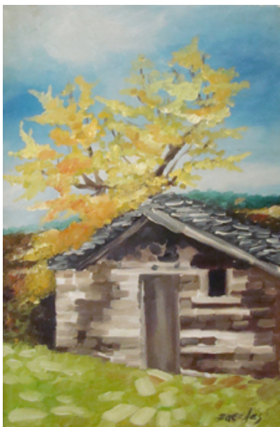
«Αποθήκη - Ζαγόρι» , Λάδια 15cm X 30cm