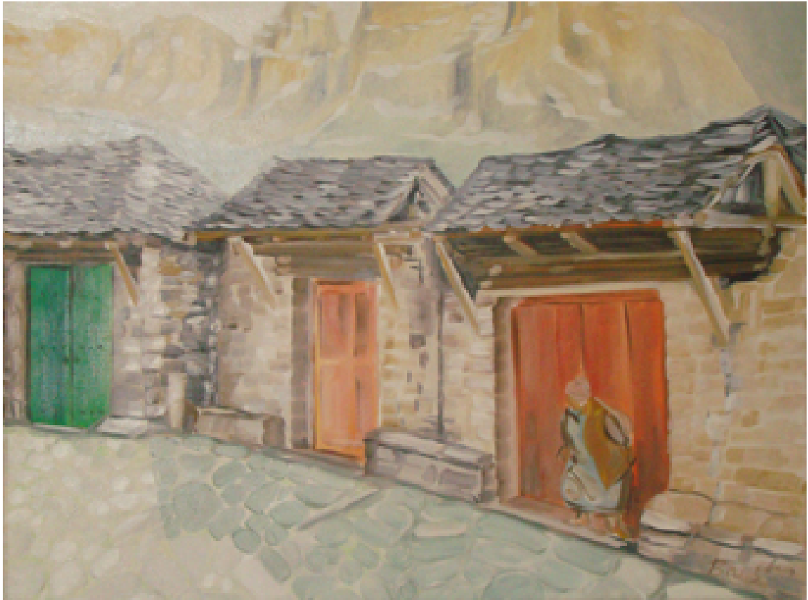
«Πάπιγγο - Ζαγόρι Ι», Λάδια 50cm X 70cm