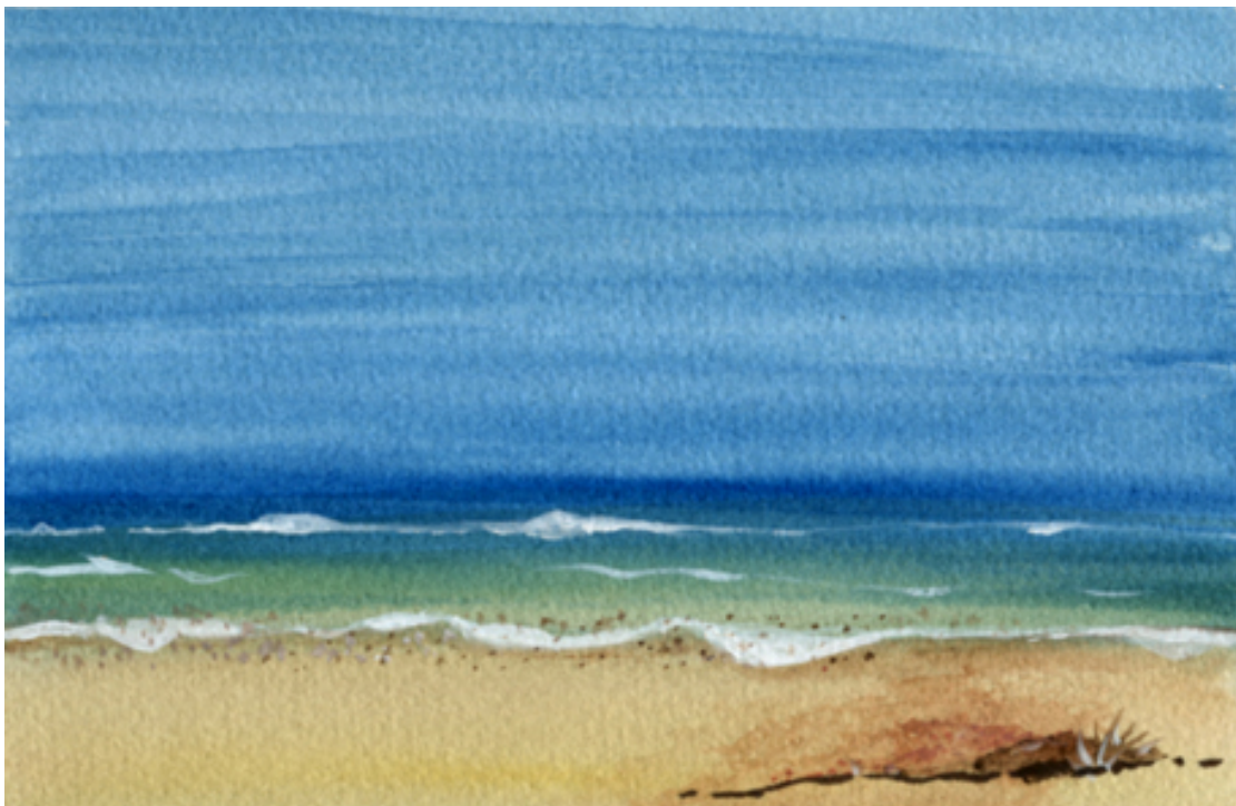
«Αγαθούπολη Πιερίας Ι», Ακουαρέλα, 12cm X 16cm