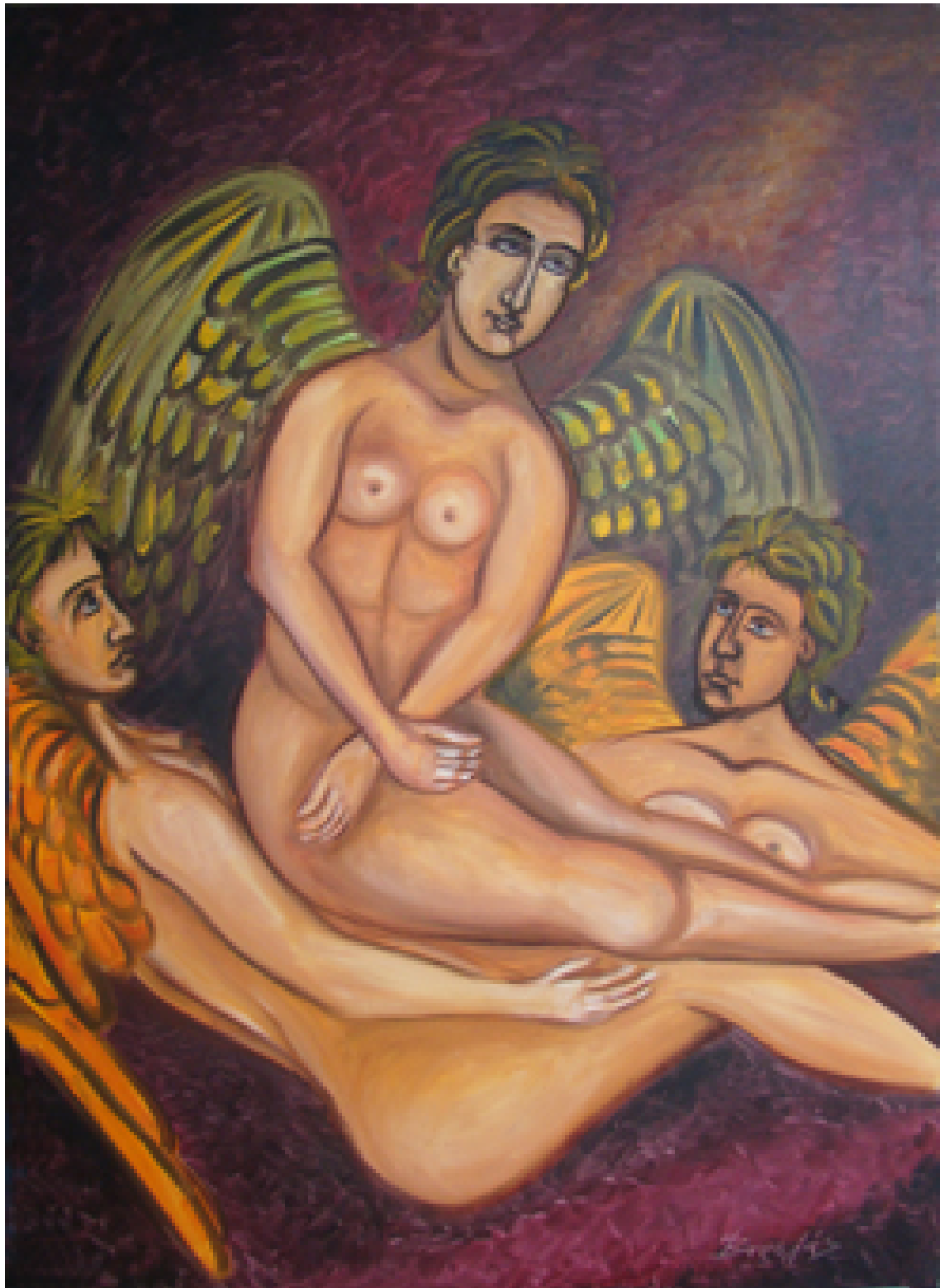
«Χερουβείμ σύναξης VI» Λάδια, 70cm X100cm