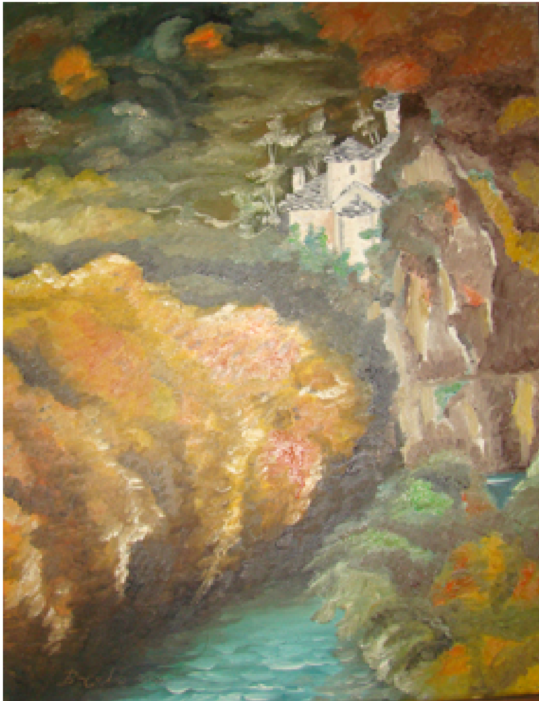
«Αγία Παρασκευή - Ζαγόρι II », Λάδια 40cm X 60cm