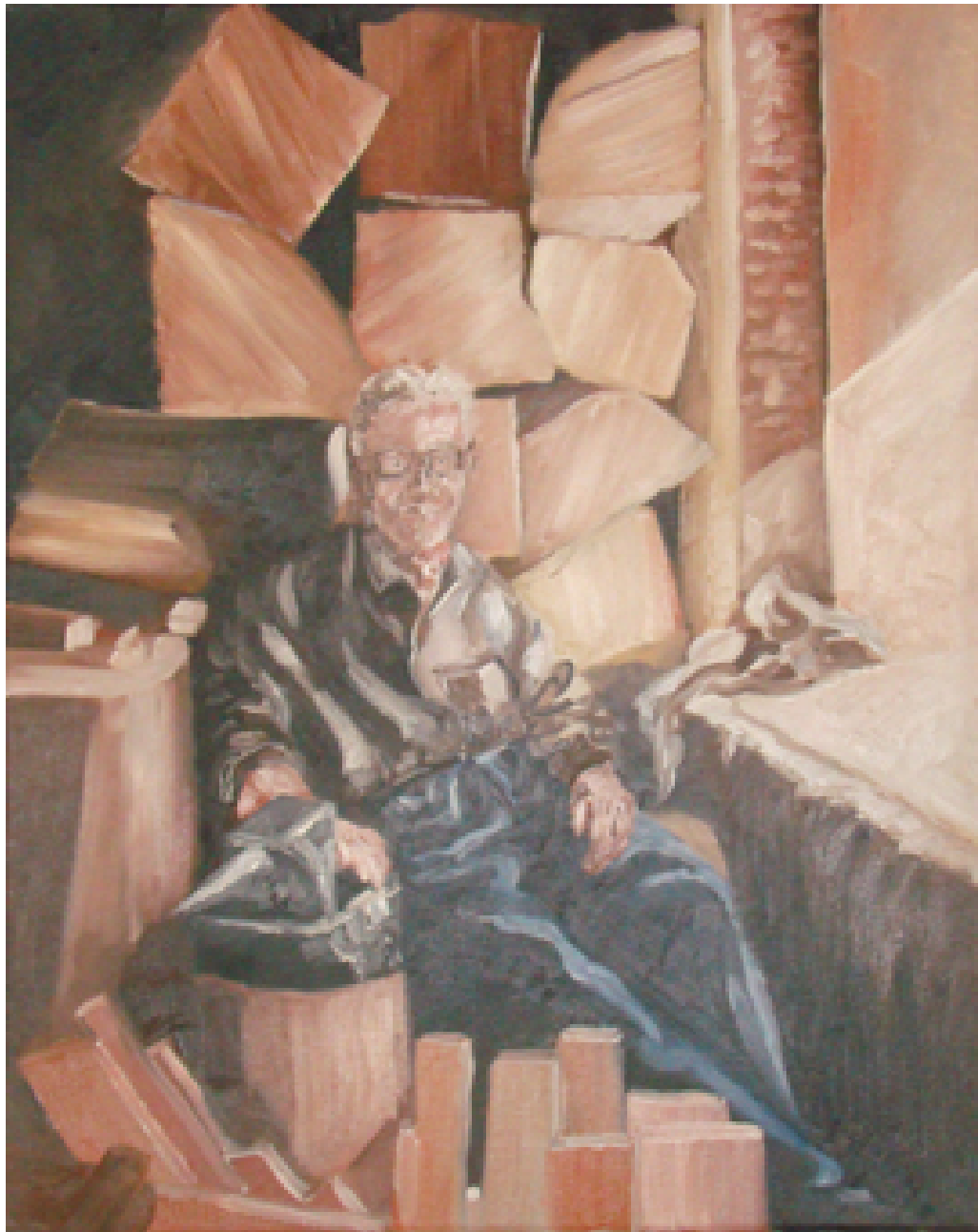
«Ευλογός», Λάδια 35cm X 50cm