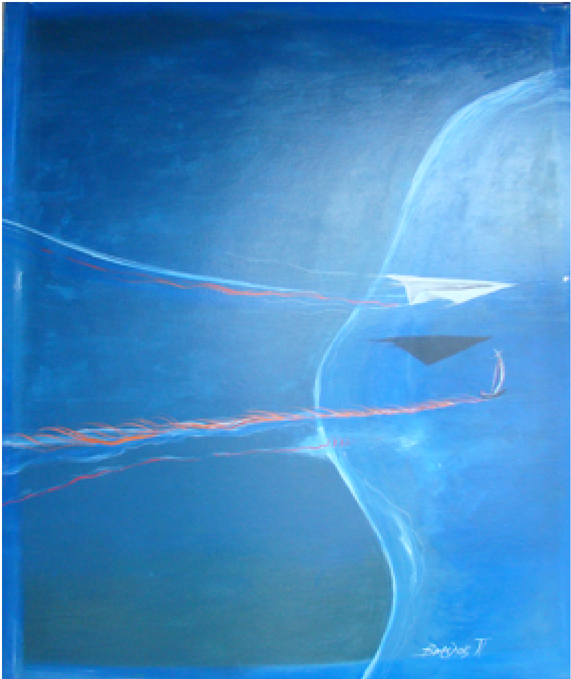
«Συνταξιδιώτες ανοιχτών οριζόντων », Λάδια 100cm X 120cm