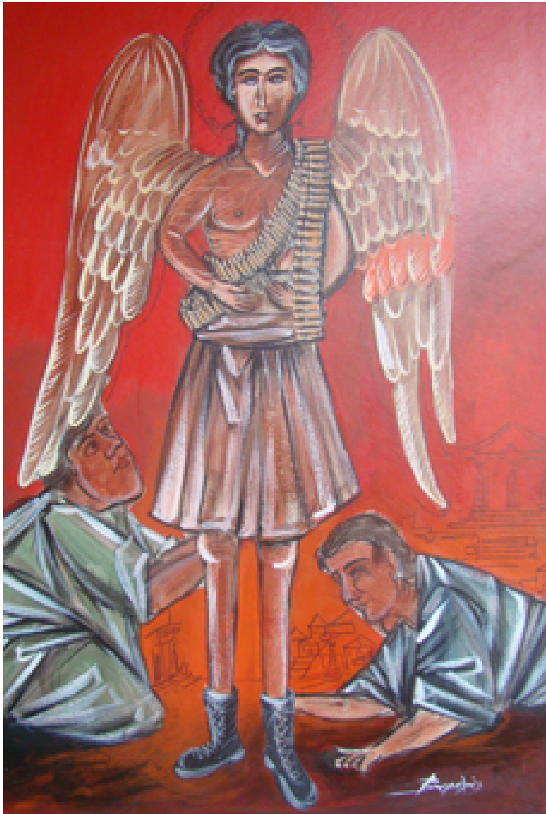
«Ο Άγιος πολεμιστής του λαού, Ακρυλικό 70cm X 100cm