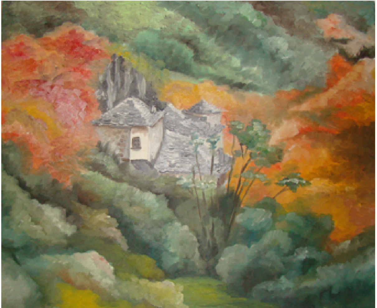
«Αγία Παρασκευή - Ζαγόρι Ι», Λάδια 40cm X 60cm