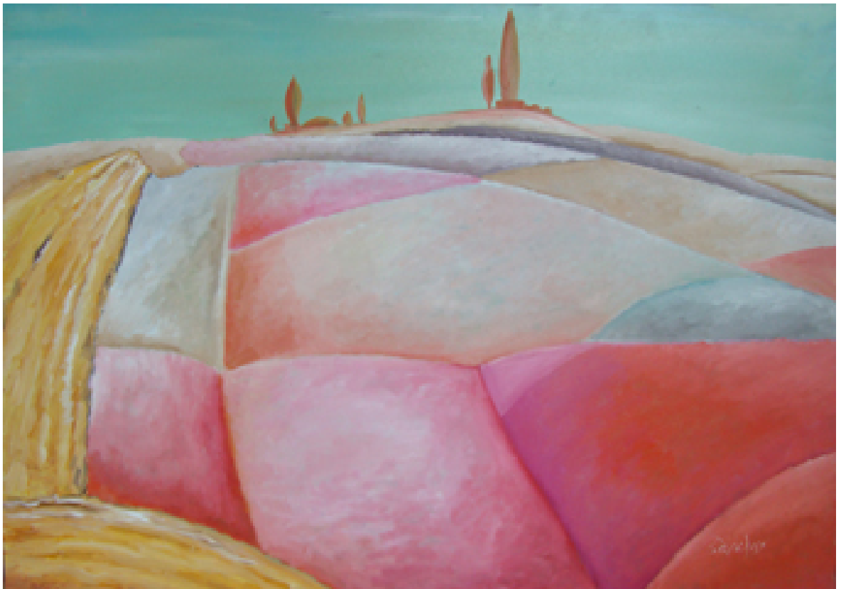
«Τοσκάνη» Λάδια 70 cm X 100cm