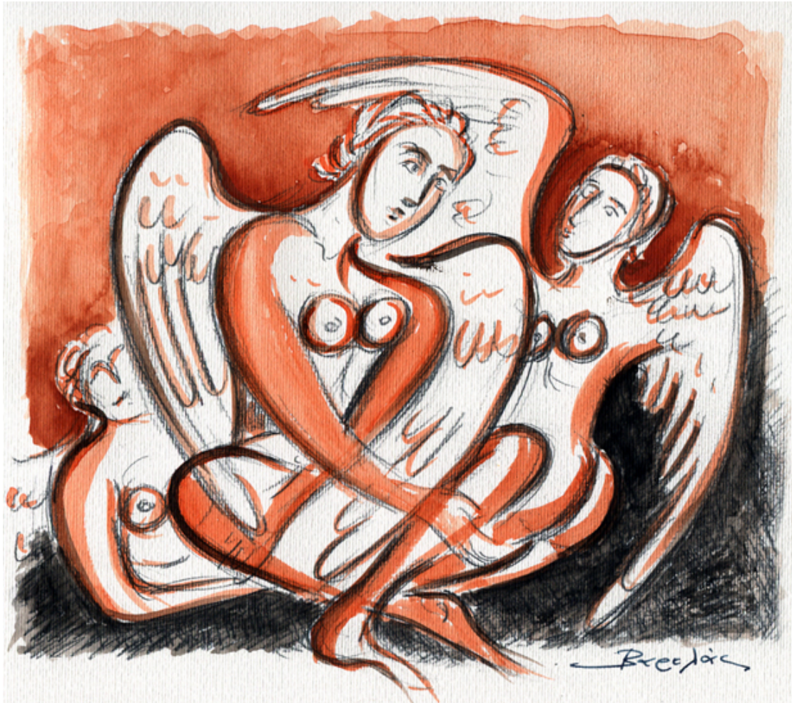
«Χερουβείμ σύναξης II» Ακουαρέλα, 25cm X32cm