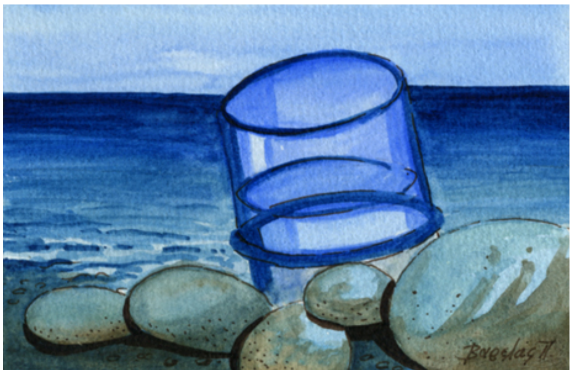
«Παραλία Παντελεήμονα», Ακουαρέλα, 12cm X 16cm