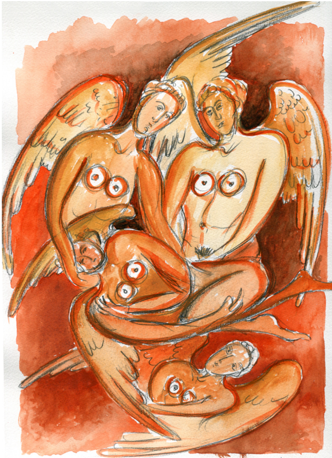
«Χερουβείμ σύναξης Ι» Ακουαρέλα, 25cm X32cm