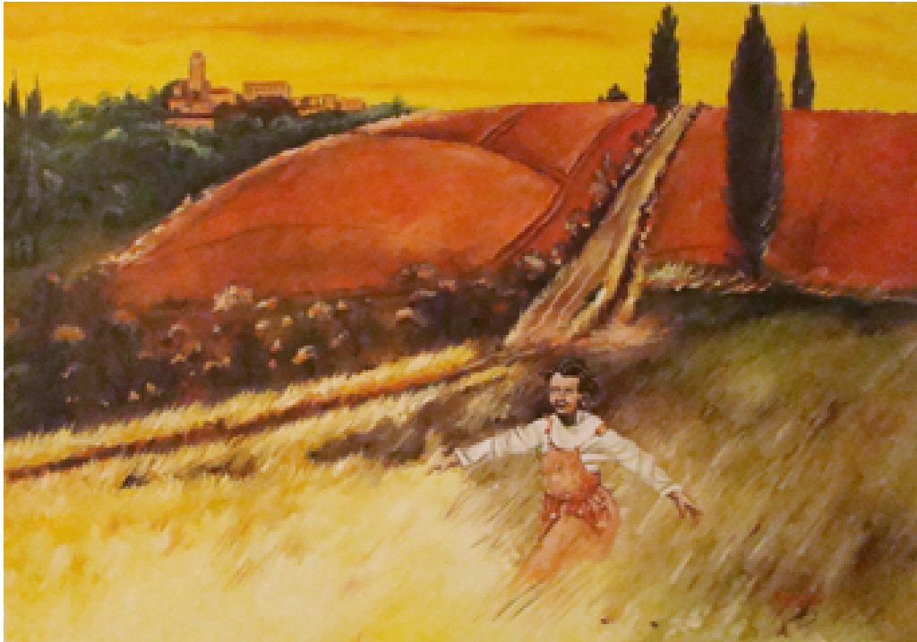
«Τοσκάνη II», Λάδια, 70cm X 100cm