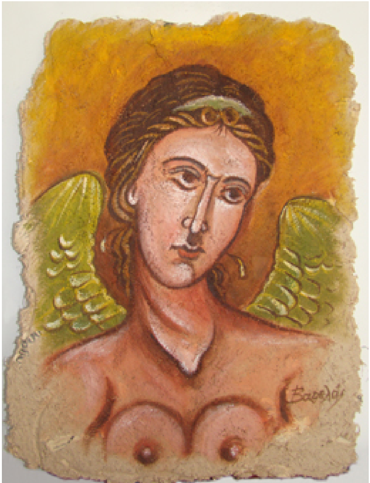
«Χερουβείμ σύναξης IV» Λάδι, 25cm X32cm

Το χαρτί πάχος 7 mm είναι κατασκευασμένο από τον ίδιο το Βαρελά από πολύ εφημερίδων