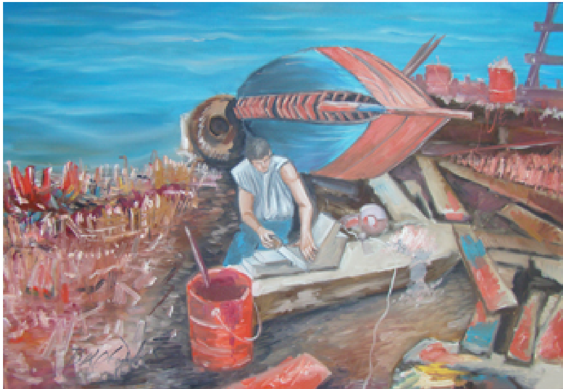
«Καρνάγιο», Λάδια 70cm X 100cm