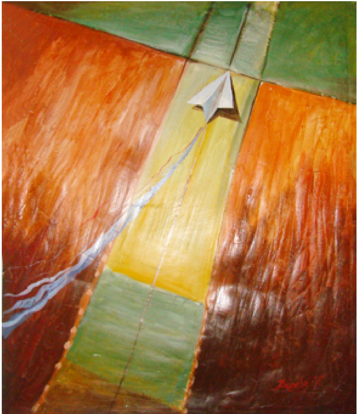
«Αγροδιαδρομος», Μεικτή τεχνική 100cm X 120cm