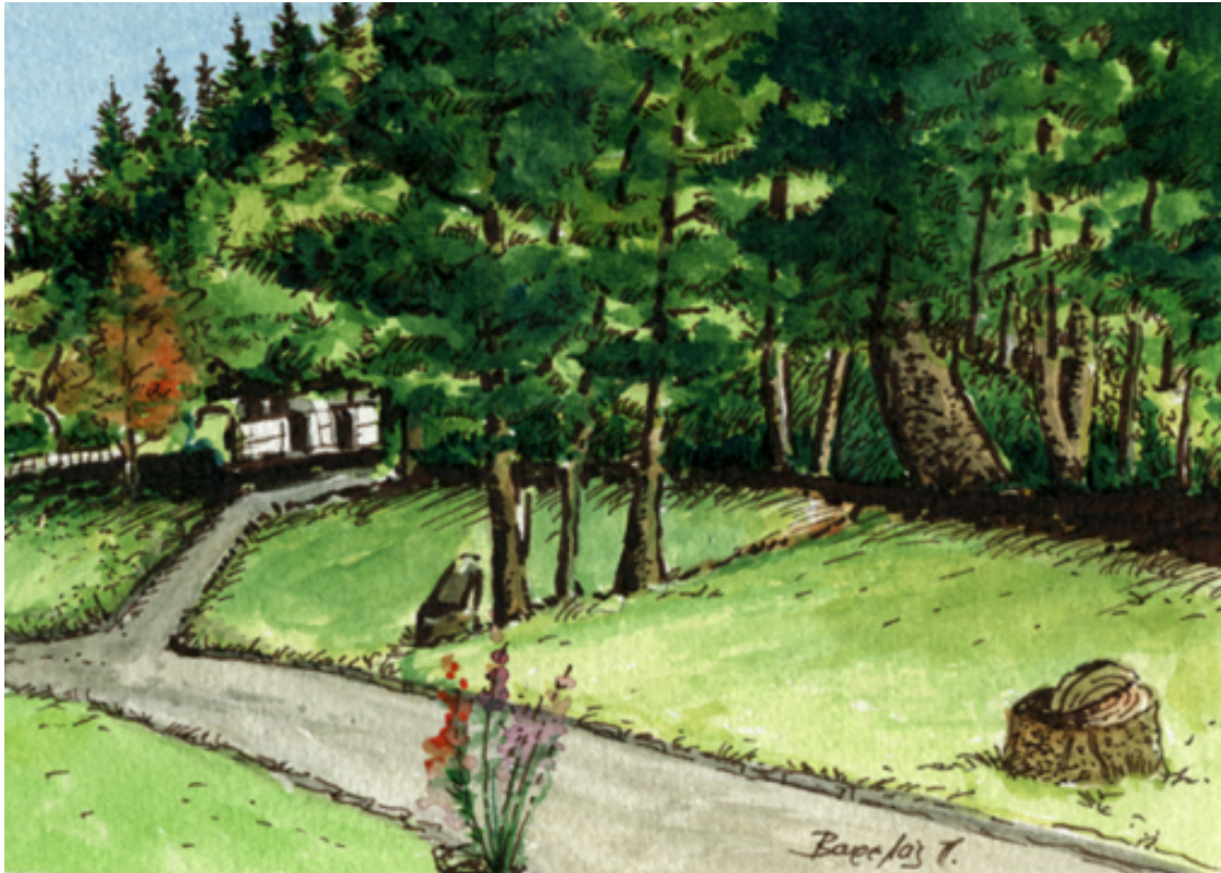
«Κάμπινγκ Βυτίνας», Ακουαρέλα, 13cm X 16cm