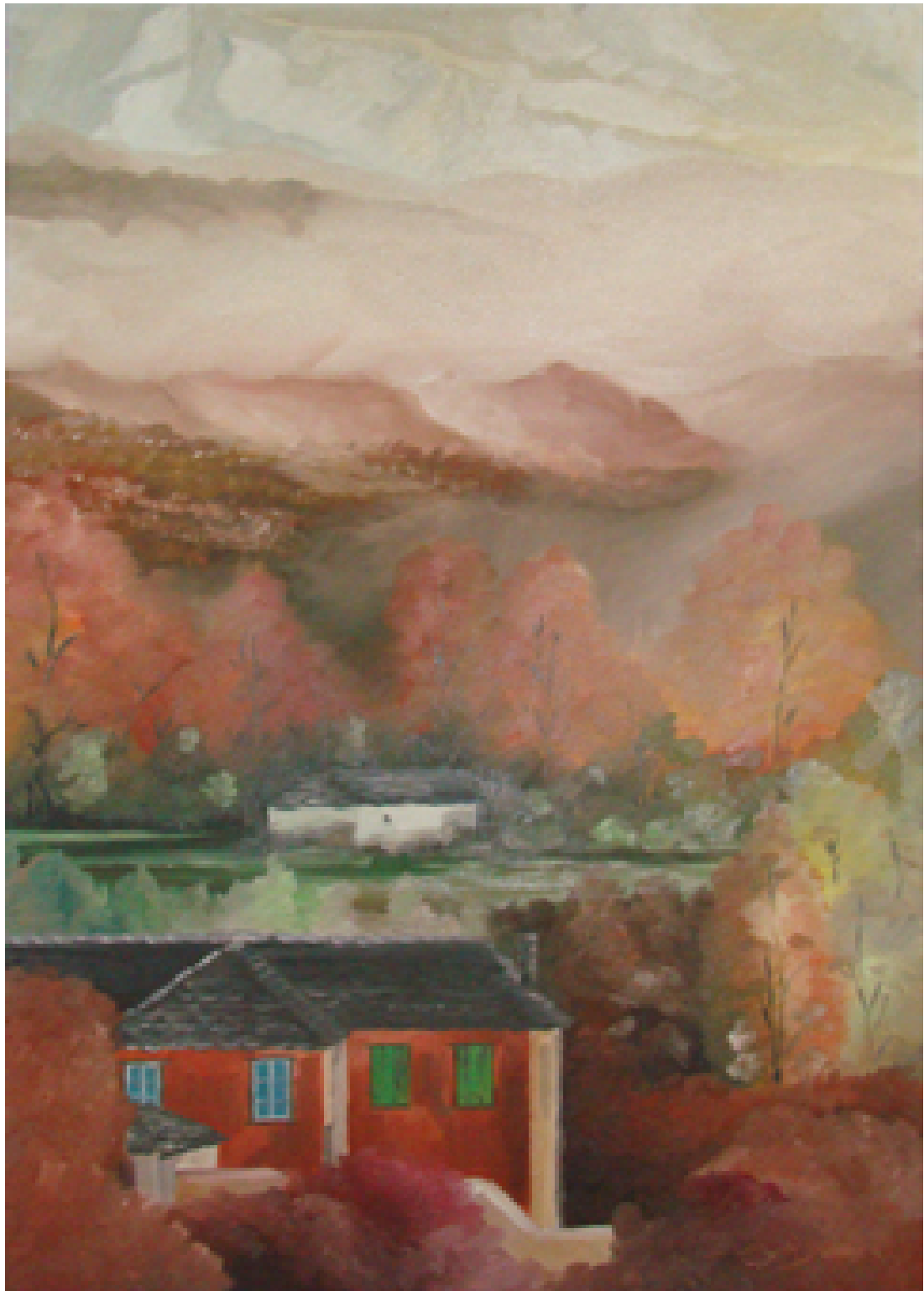
«Ζαγόρια - Πίνδος Ι», Λάδια 50cm X 70cm