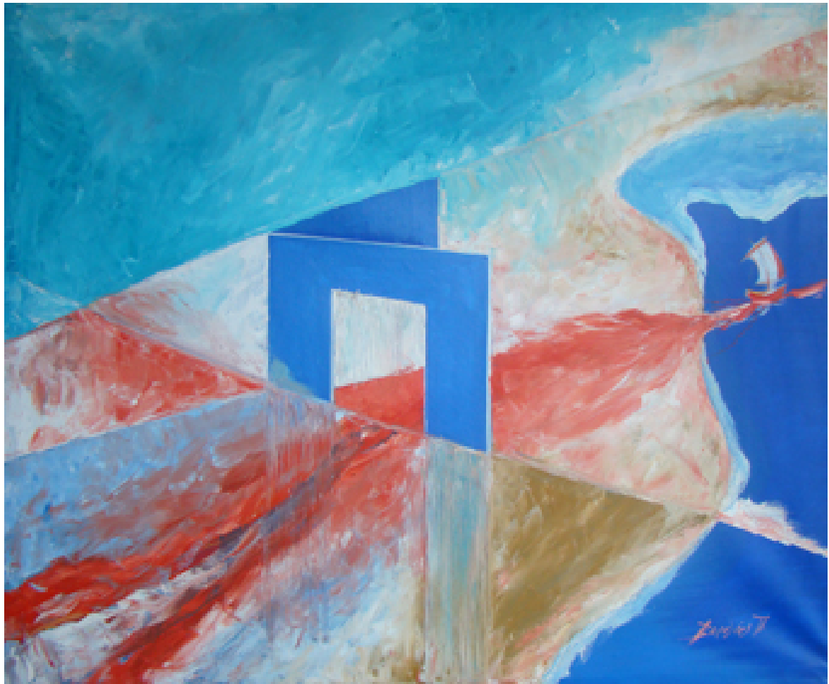
«Οι πόρτα των οριζόντων », Λάδια 100cm X 120cm