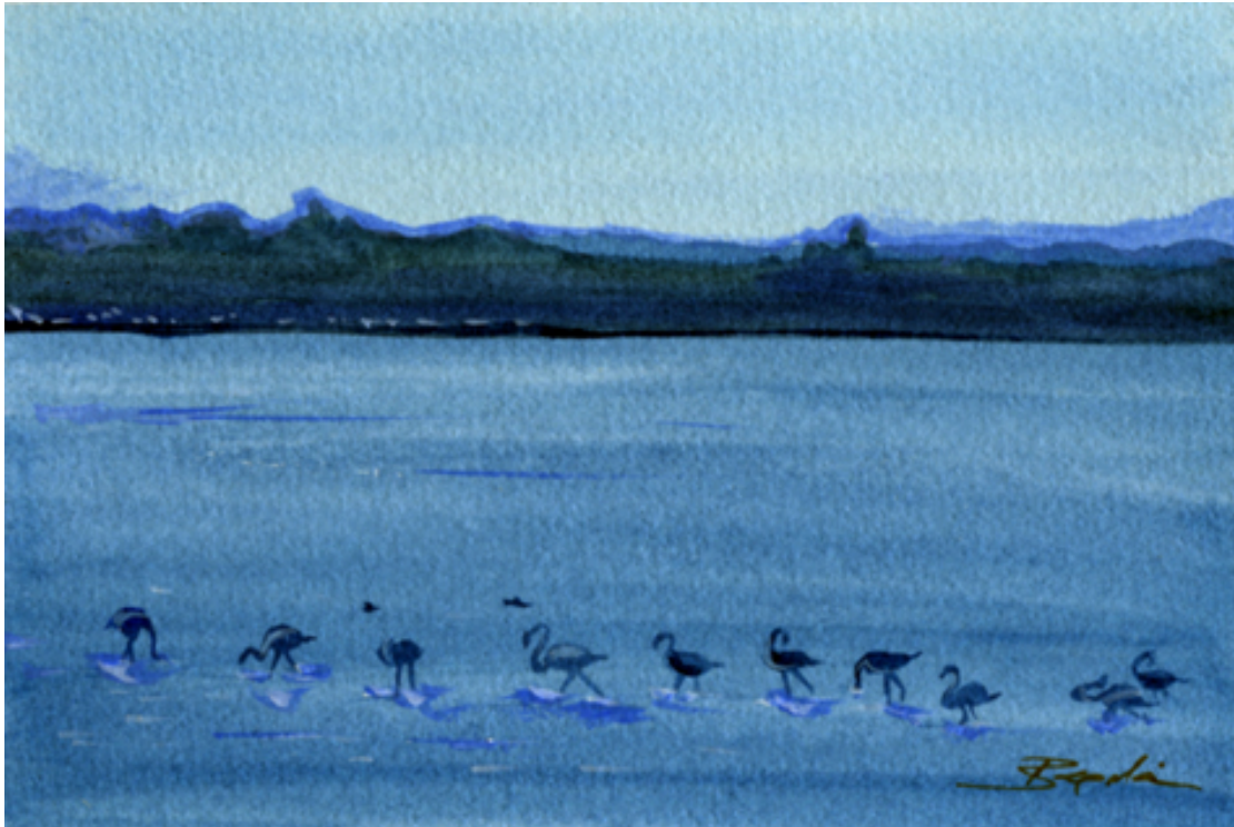
«Αγαθούπολη Πιερίας», Ακουαρέλα, 12cm X 16cm