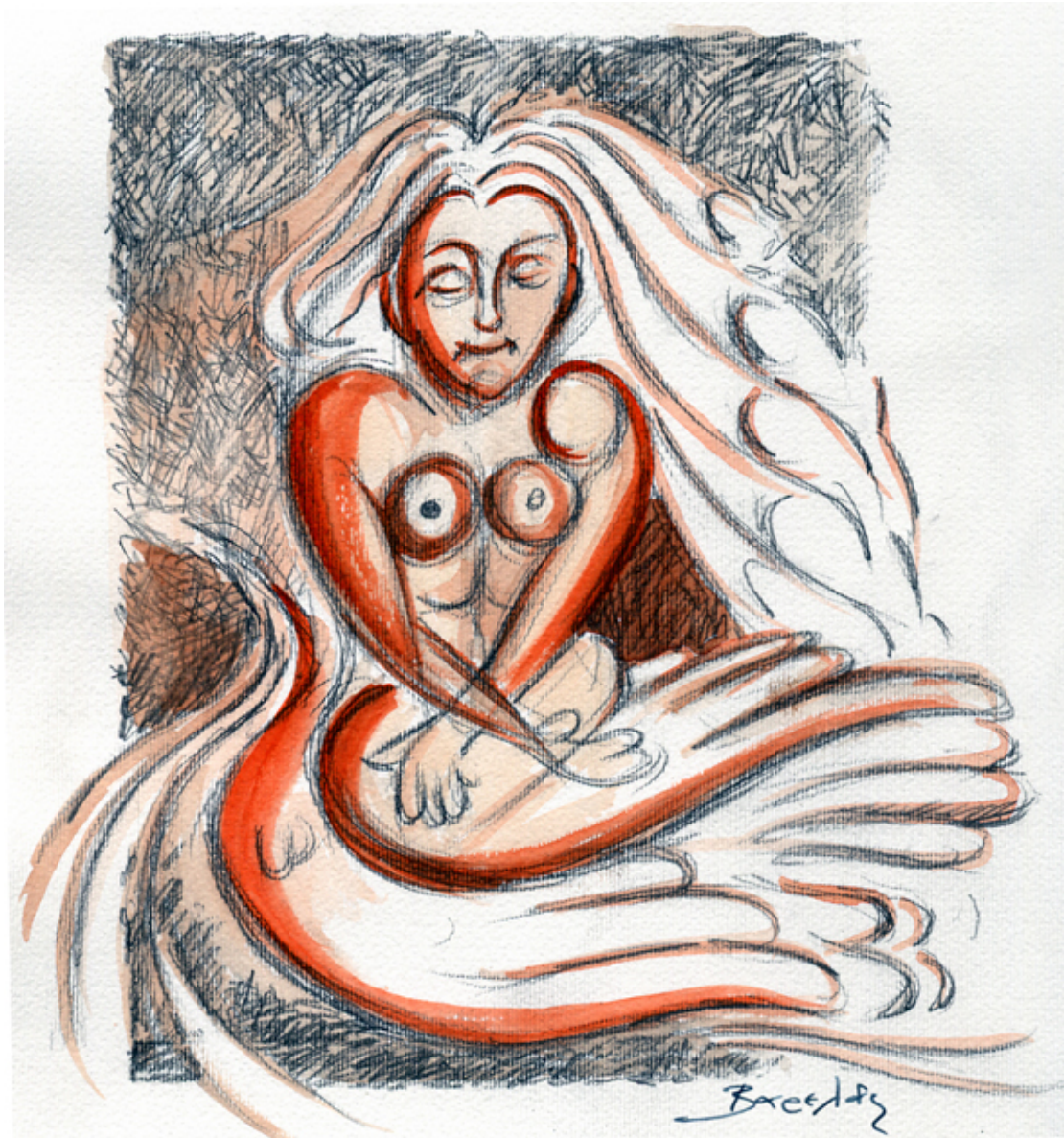
«Χερουβείμ σύναξης III» Ακουαρέλα, 25cm X32cm