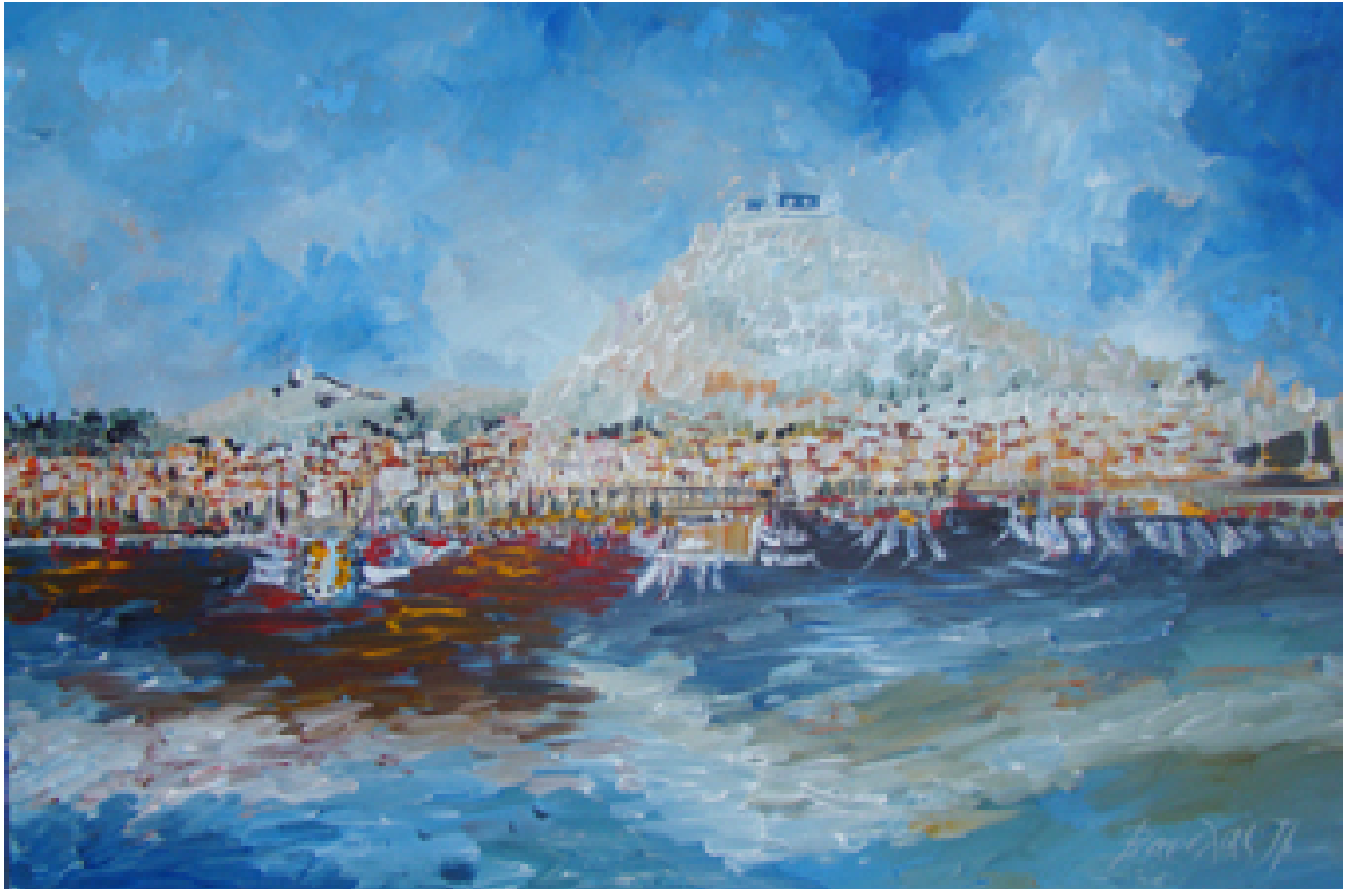
«Σαλαμίνα» Ακρυλικό 50cm X 70cm