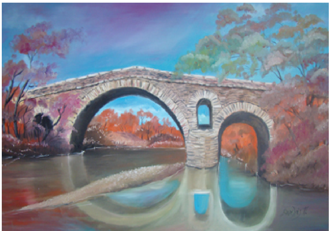
«Τσεπέλοβο», Λάδια 70cm X 100cm