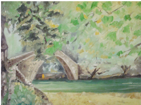
«Γεφύρι Βίνιανης» , Λάδια 30cm X 50cm