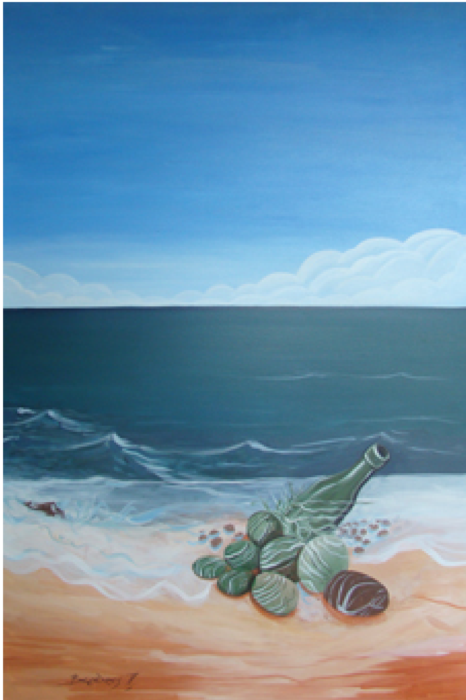
«Είμαι καλά» , Λάδια 80cm X 160cm