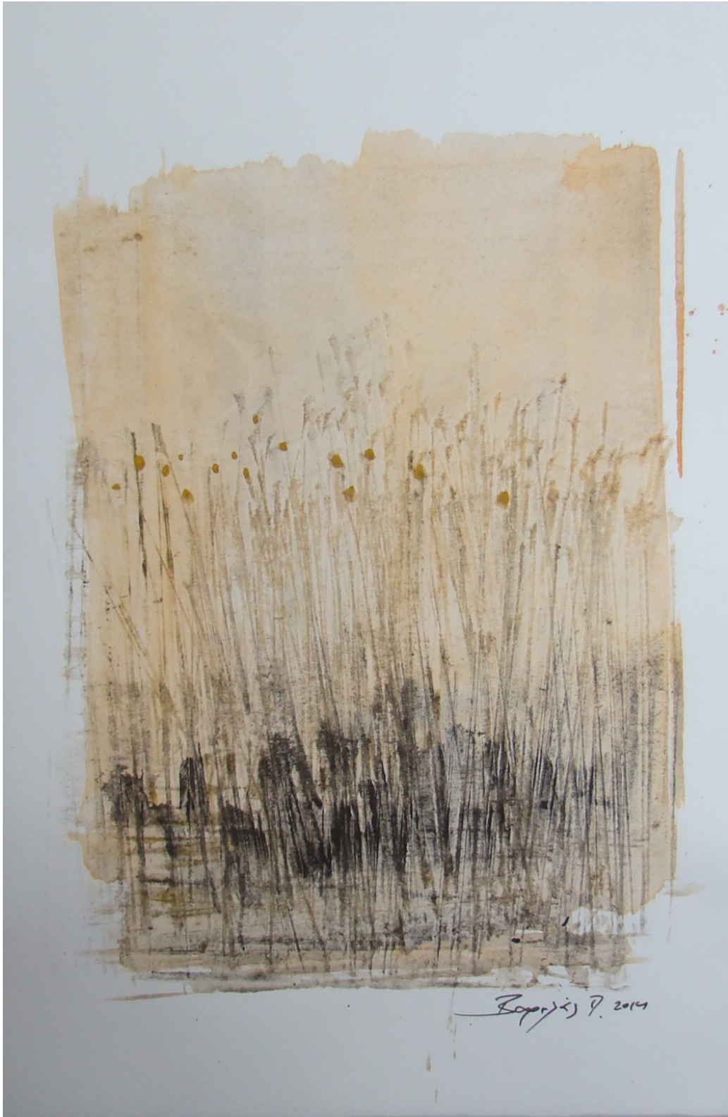
«Βαρκότοπος» 18cm X 25cm, Μεικτή τεχνική, 2013