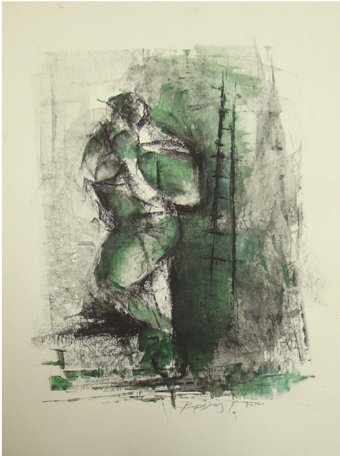
«Κουβαλόντας το σάκο II » 25cm X 35 cm, Μεικτή τεχνική, 2013