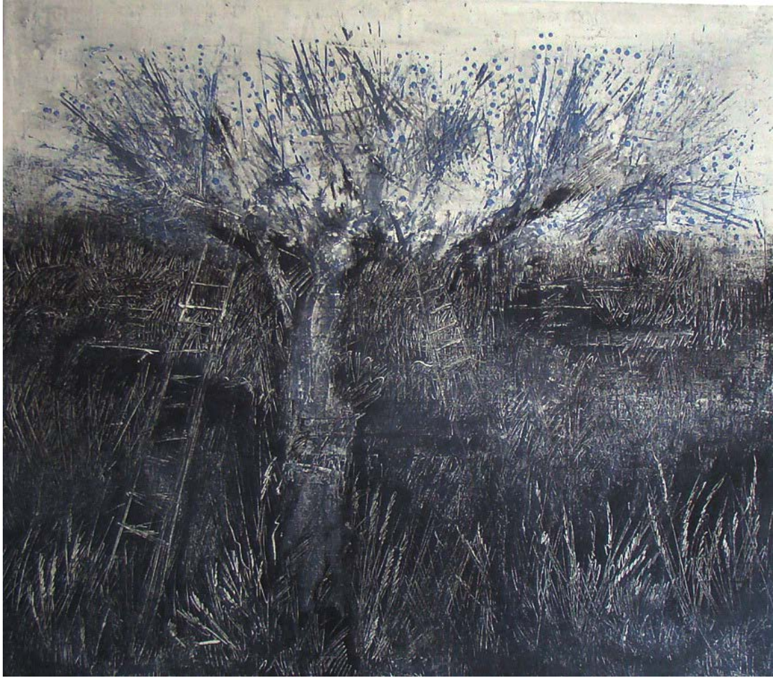
«Μάζεμα της ελιάς VIIi» 120cm X 140 cm, Μεικτή τεχνική , 2013