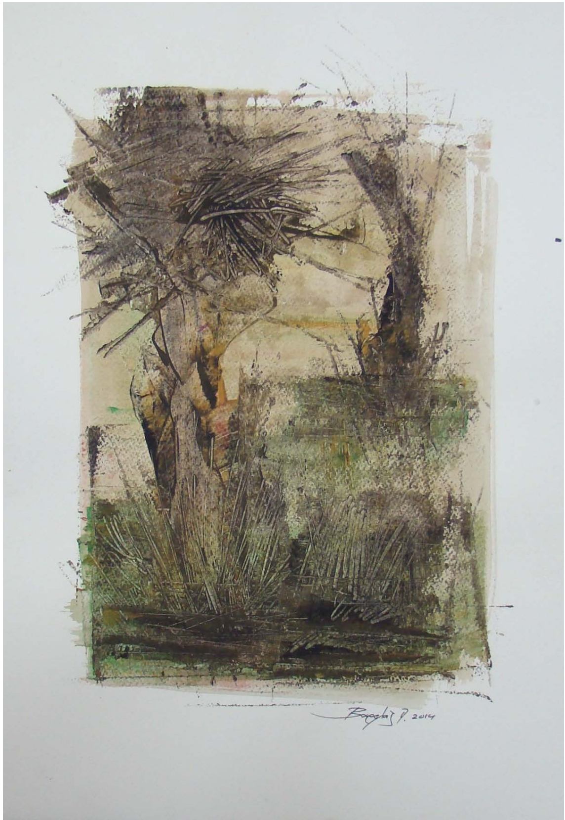
«Ζόμπουλ» 35cm X 50 cm, Μεικτή τεχνική, 2013