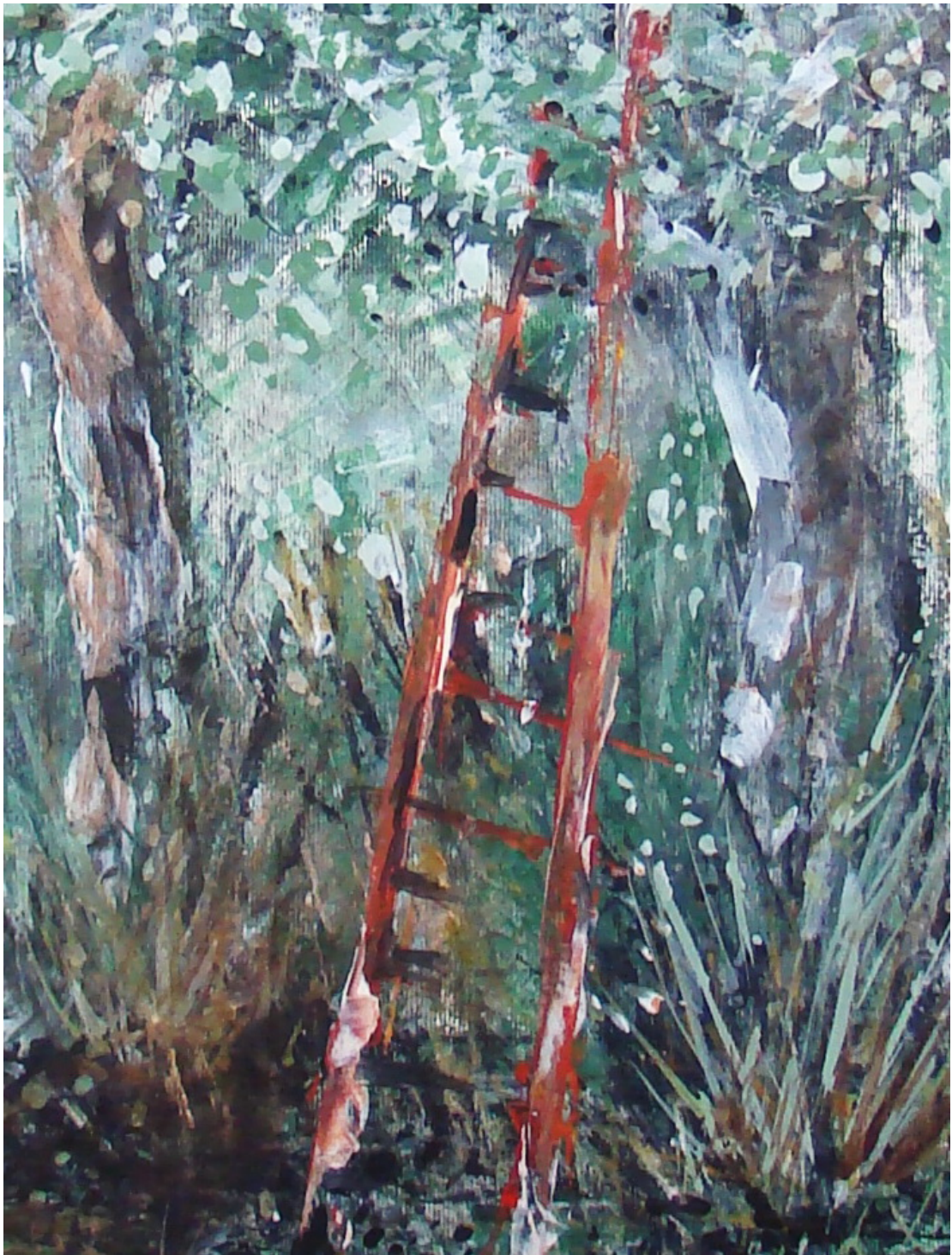
«Στη σκάλα IV» 29cm X 43cm, Ξηρό παστέλ, 2015