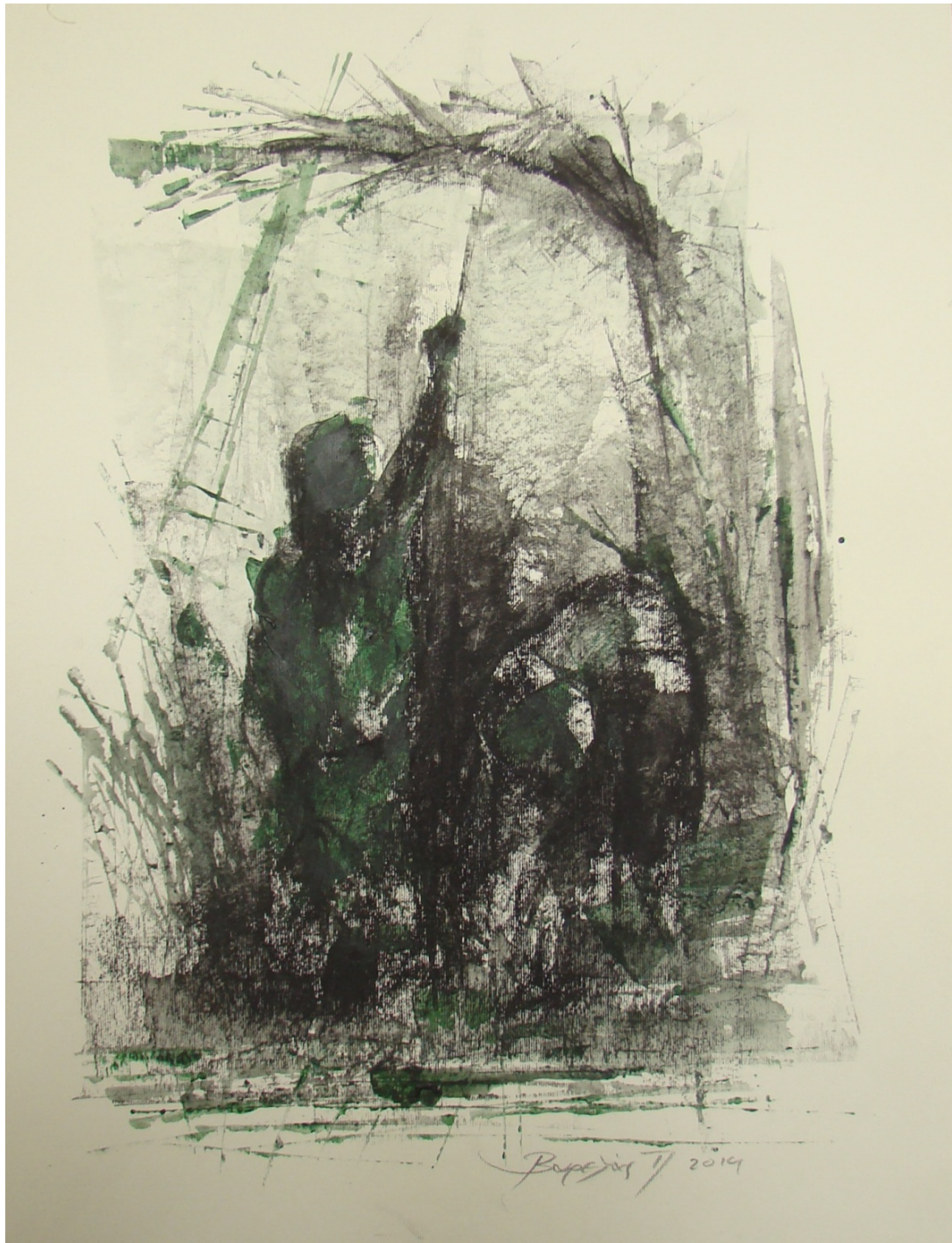
«Χτυπώντας» 35cm X 50 cm, Μεικτή τεχνική, 2013