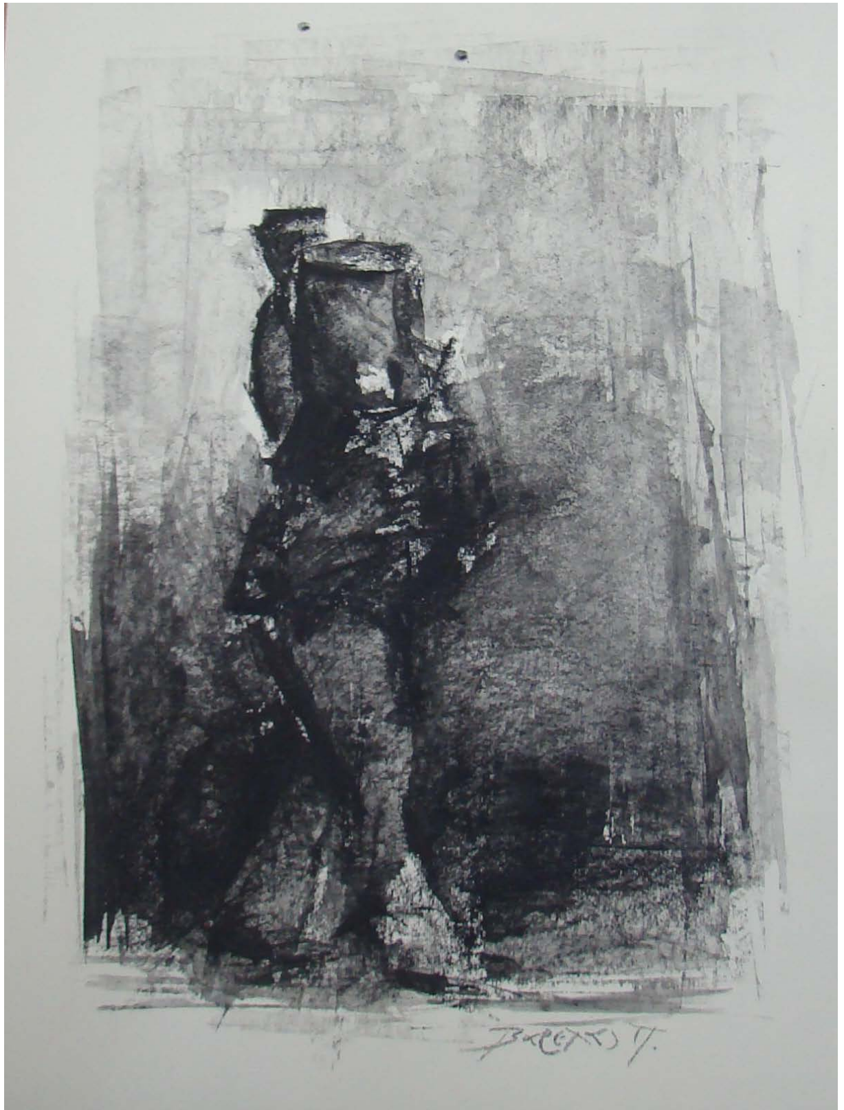
«Κουβαλώντας το σάκο» 25cm X 35 cm, Μεικτή τεχνική, 2013