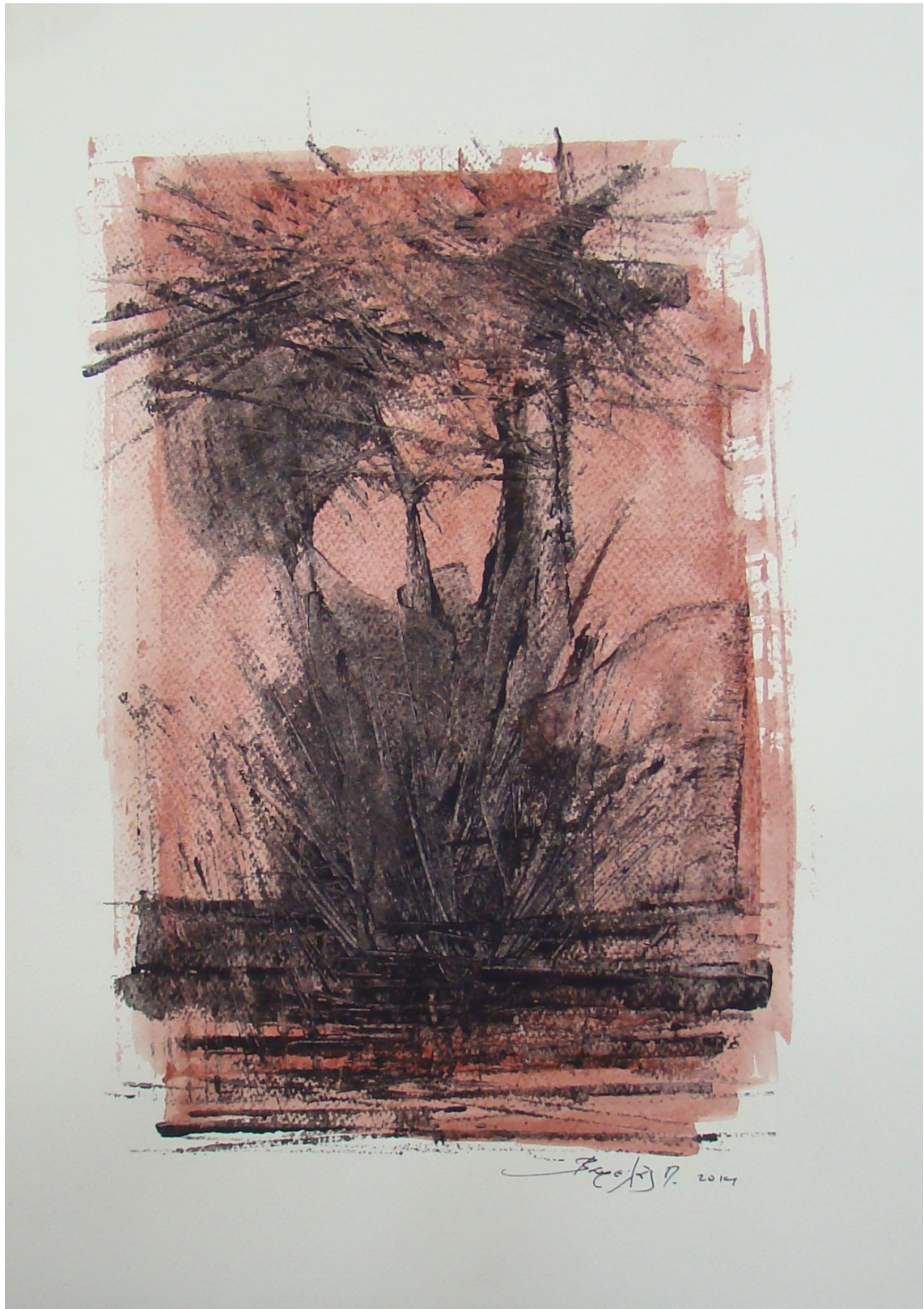
«Κοκκινόγια VII» 25cm X 35 cm, Μεικτή τεχνική, 2013