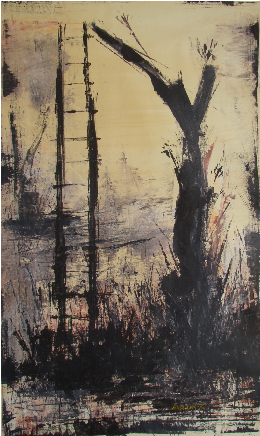
«Θα ξανάρθουν» 35cm X 50 cm, Μεικτή τεχνική, 2013