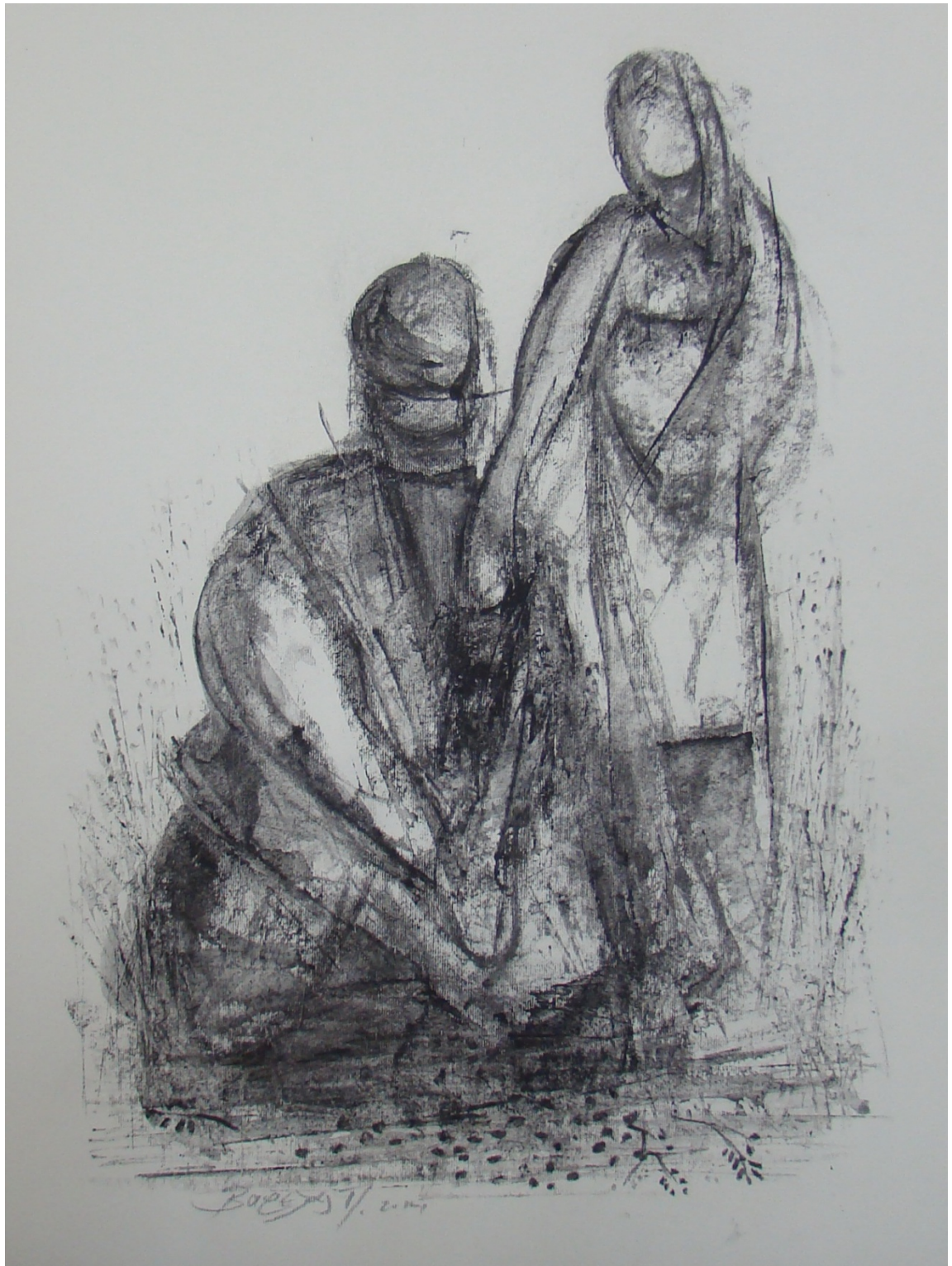
«Χαμάδες» 25cm X 35 cm, Μεικτή τεχνική, 2013