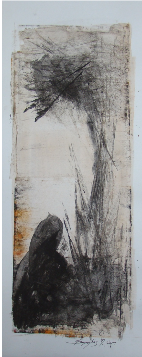
«Βυθισμένο» 35cm X 20cm, Μεικτή τεχνική , 2013