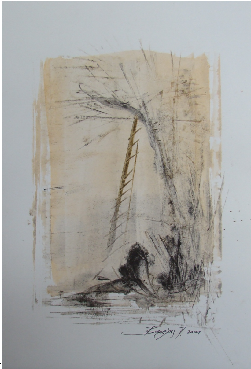
«Γυναίκες III» 15cm X 25 cm, Μεικτή τεχνική, 2013