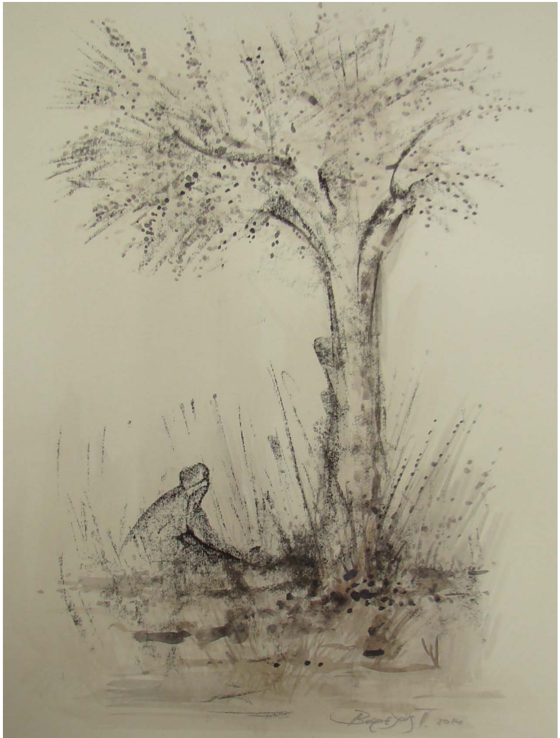
«Μόνη και έρημα» 15cm X 25 cm, Μεικτή τεχνική, 2013