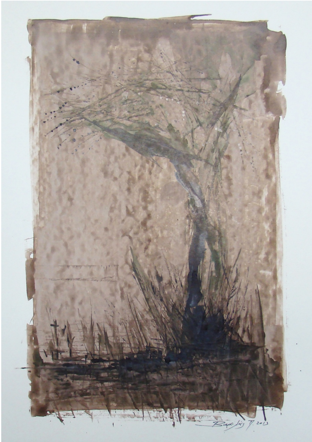
«Ελιά σε αγροτόσπιτο» 21cm X 29cm, Μεικτή τεχνική, 2013 «Ελιά σε αγροτόσπιτο» 35cm X 50 cm, Μεικτή τεχνική, 2013