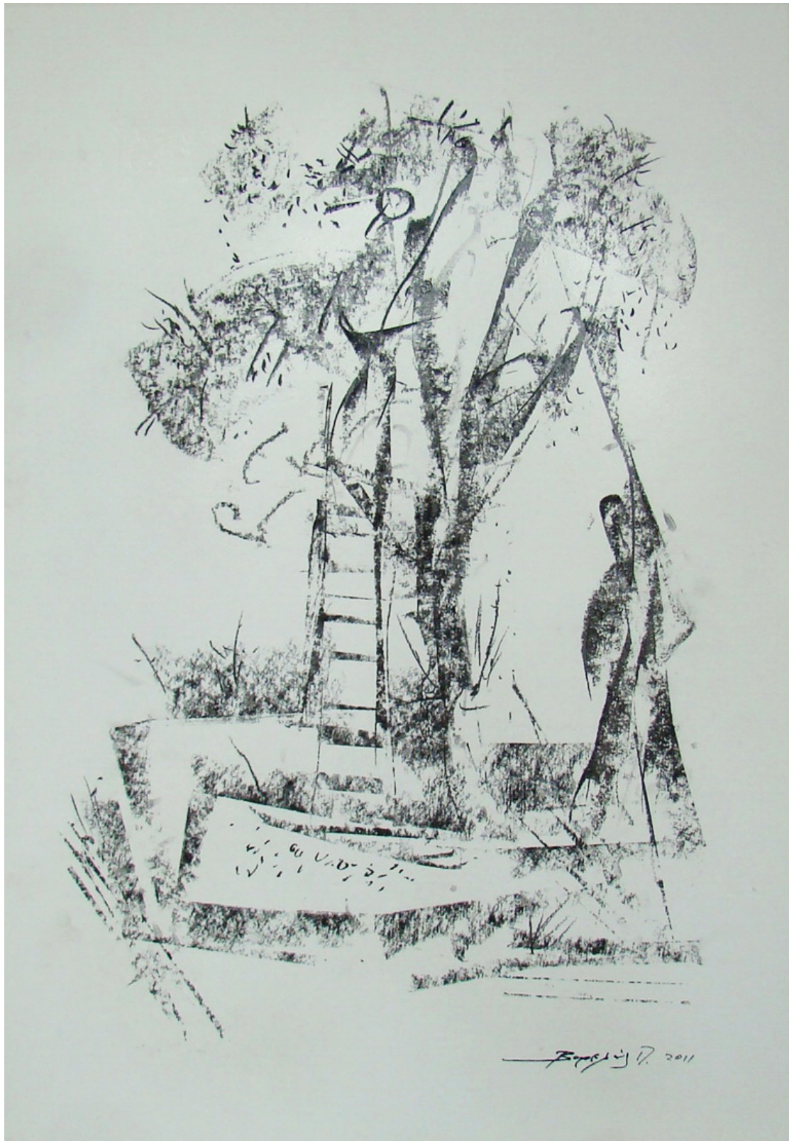
«Μάζεμα της ελιάς IV» 35cm X 50 cm, Ξηρό Παστέλ , 2013