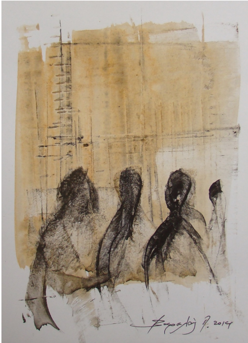
«Γυναίκες I» 15cm X 25 cm, Μεικτή τεχνική, 2013