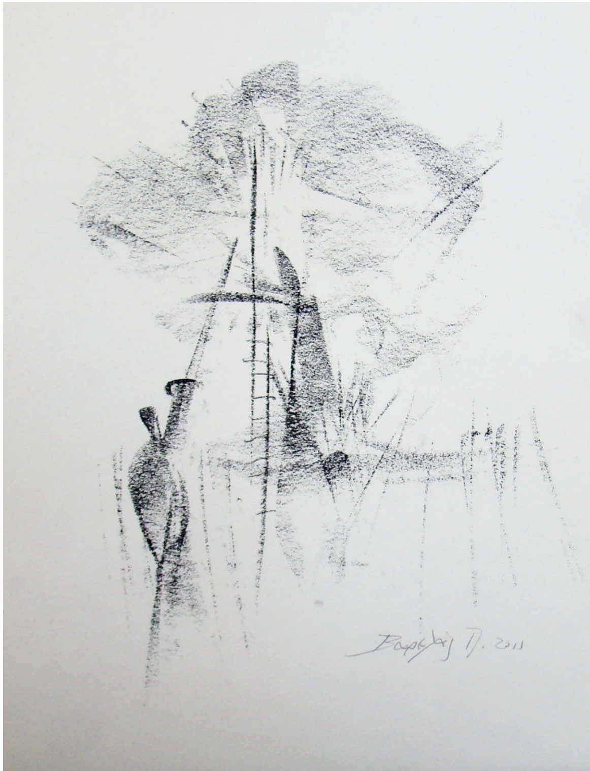
«Στη σκάλα» 29cm X 43cm, Ξηρό παστέλ, 2013