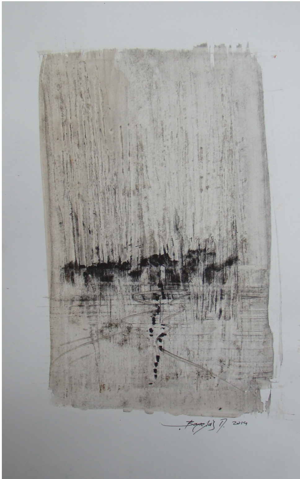
«Ελιές στη ρεματια» 15cm X 25 cm, Μεικτή τεχνική, 2013