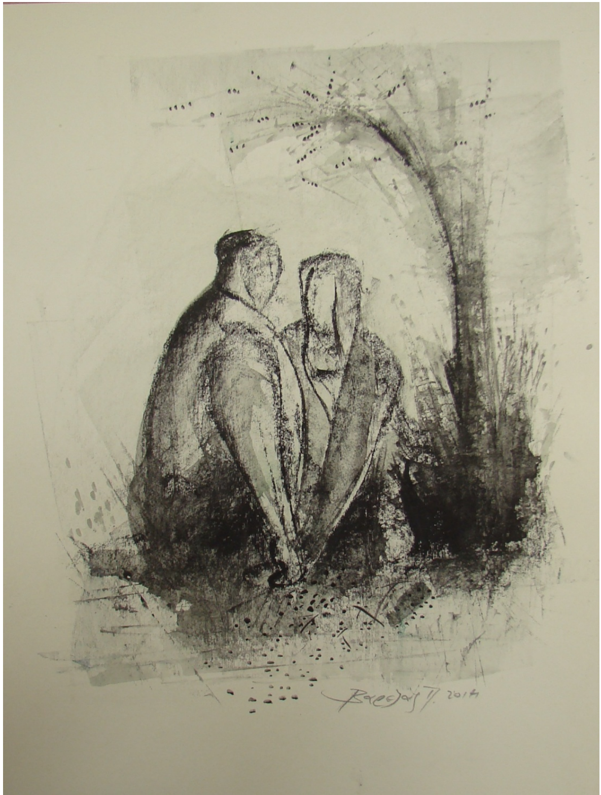
«Κάτι γεννιέται» 35cm X 50 cm, Μεικτή τεχνική, 2013