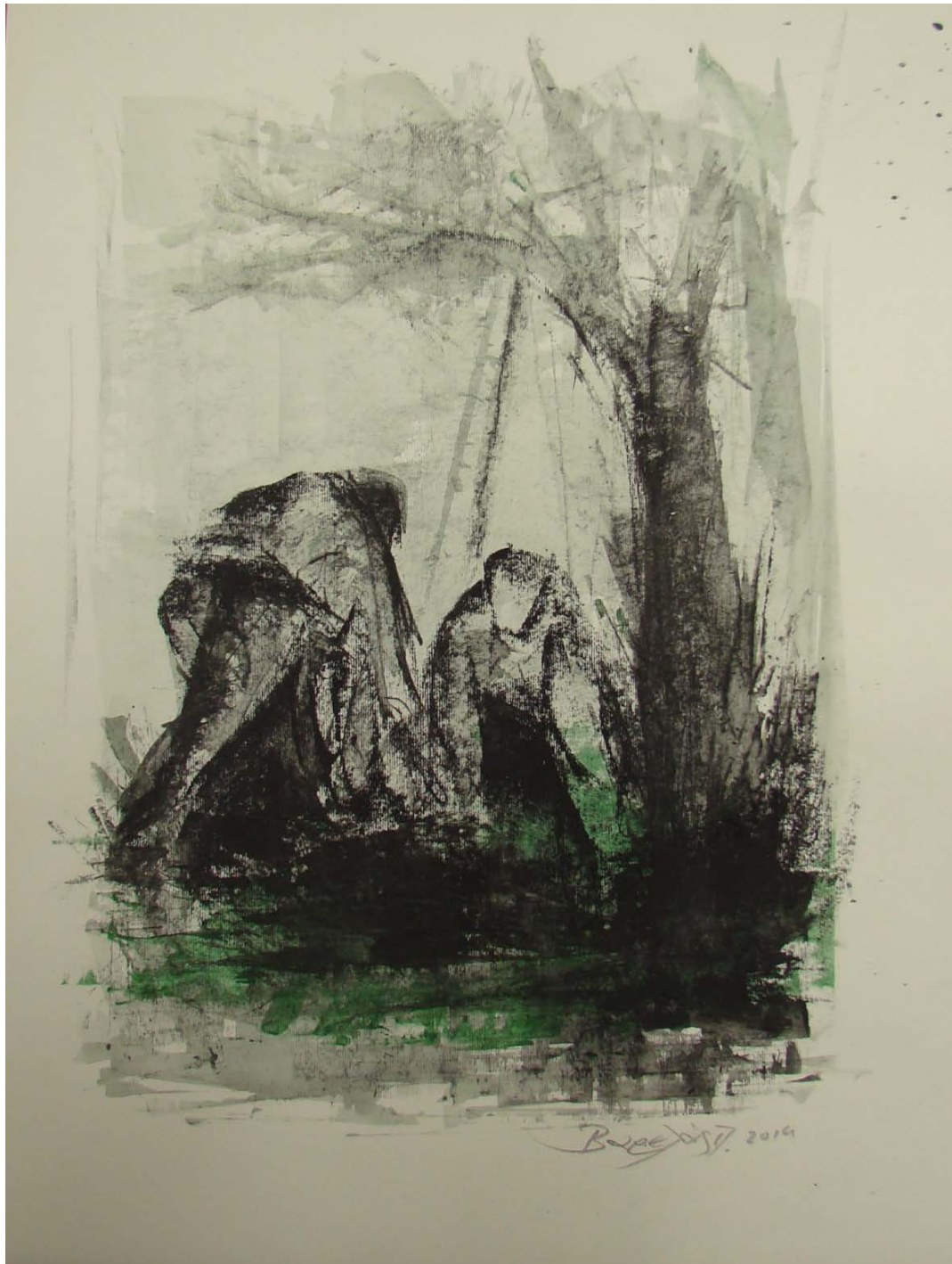
«Στα τελειώματα» 35cm X 50 cm, Μεικτή τεχνική, 2013