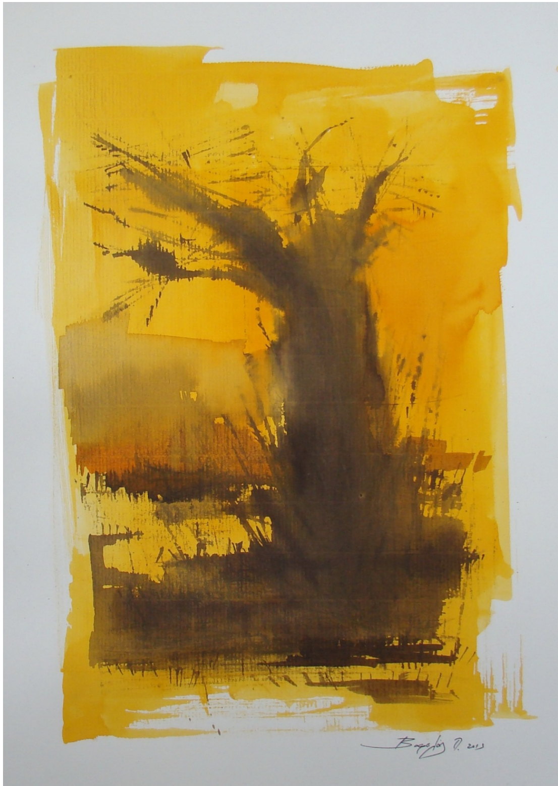
«Σκασμένη γη» 35cm X 50 cm, Μεικτή τεχνική, 2013