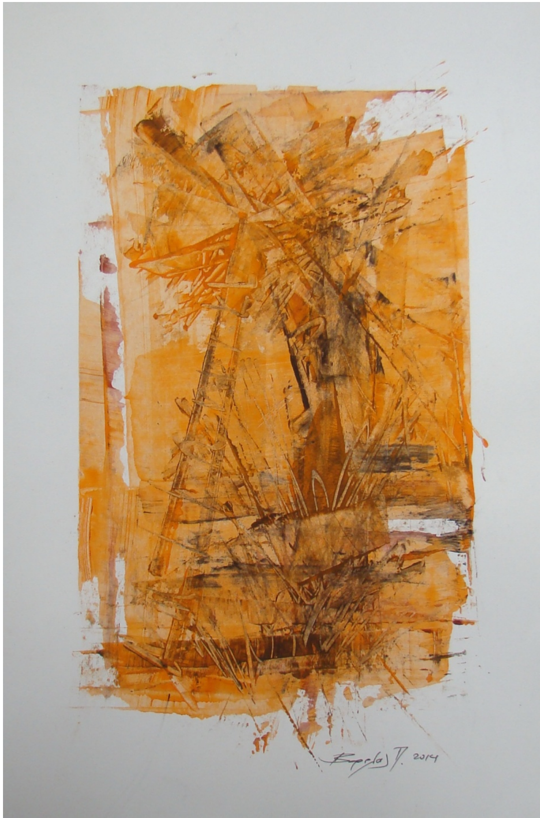
«Πύργος» 25cm X 35 cm, Μεικτή τεχνική, 2013