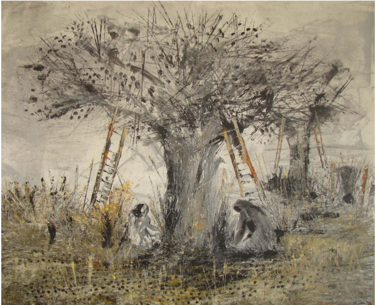
«Μάζεμα της ελιάς» 120cm X 140 cm, Μεικτή τεχνική, 2013