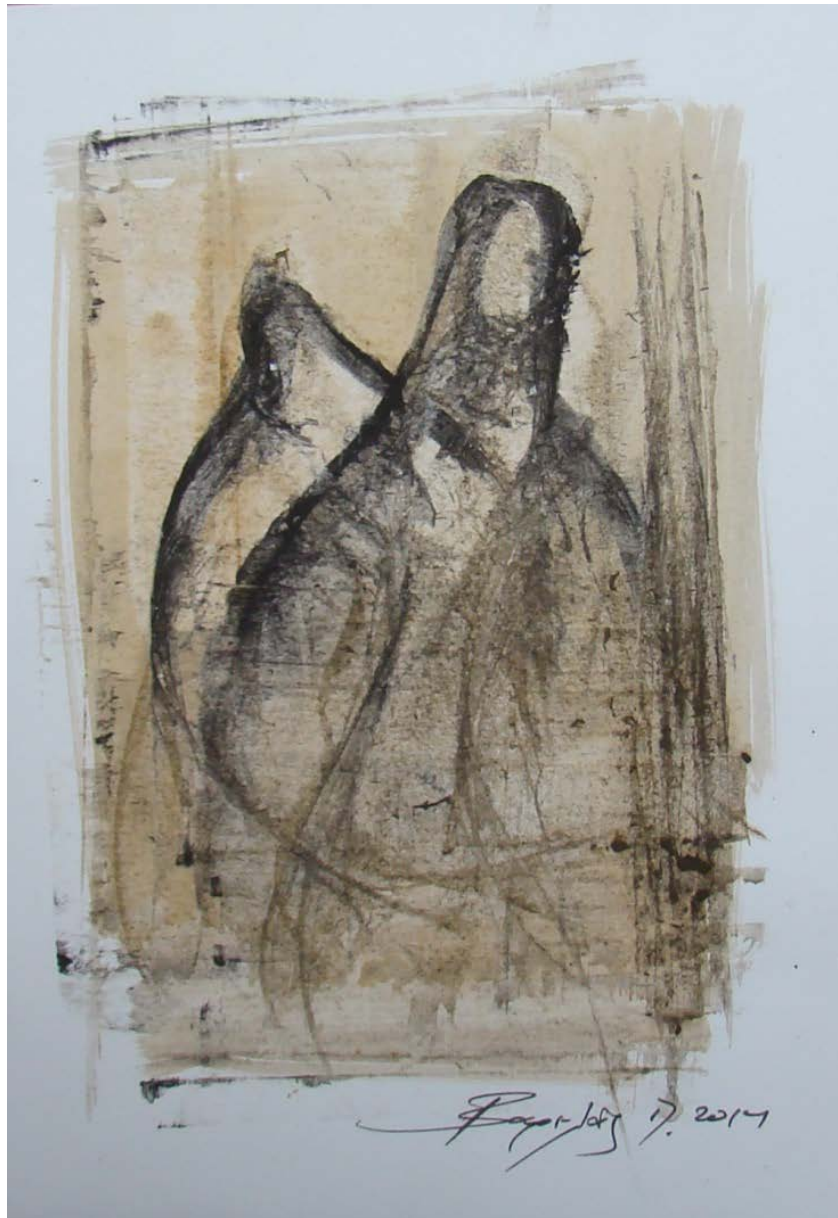
«Γυναίκες I» 15cm X 25 cm, Μεικτή τεχνική, 2013