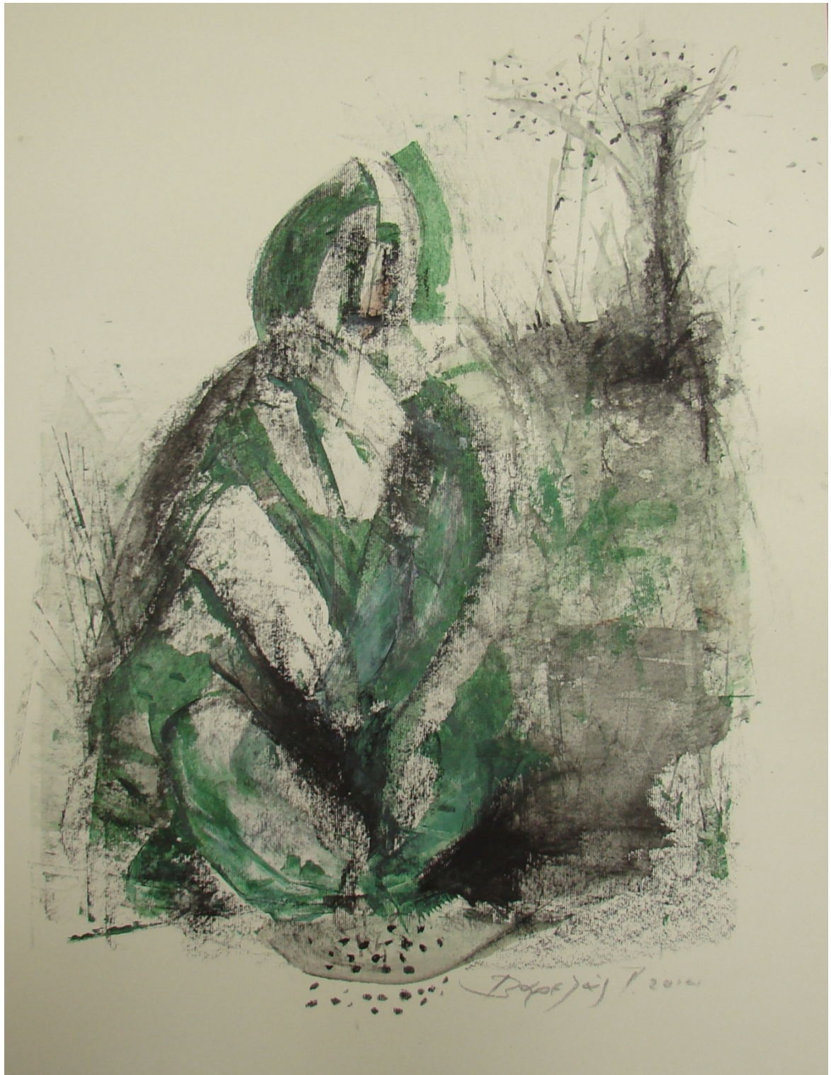
«Χαμάδες» 35cm X 50 cm, Μεικτή τεχνική, 2014