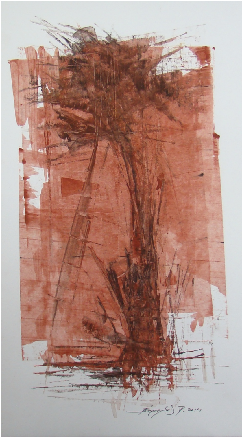
«Κοκκινόγια II» 25cm X 35 cm, Μεικτή τεχνική, 2013