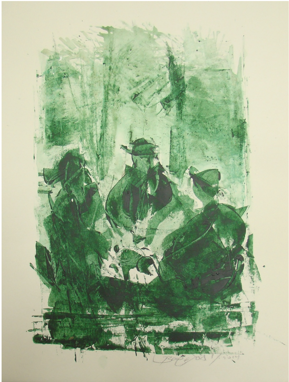
«Ξαπόσταμα» 35cm X 50 cm, Μεικτή τεχνική, 2013