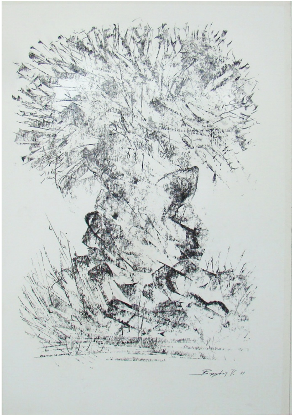
«Γέρικη ελιά» 35cm X 50 cm, Ξηρό Παστέλ, 2013