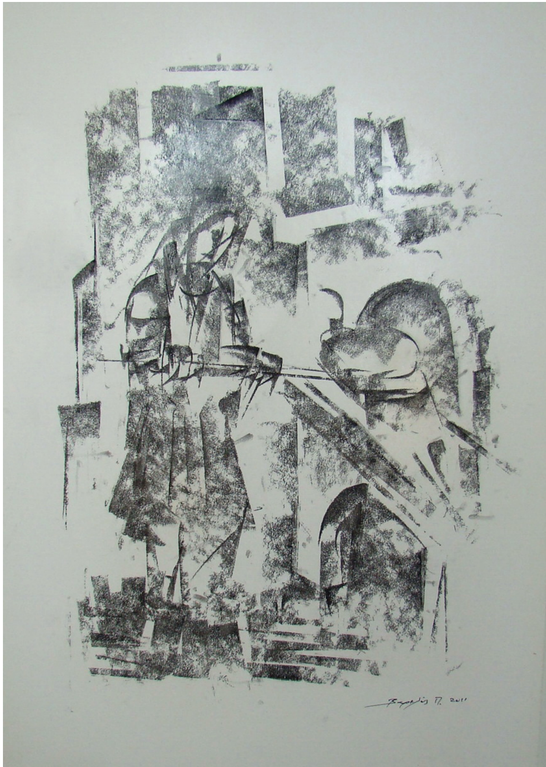
«Φούρνισμα» 35cm X 50 cm, Ξηρό Παστέλ , 2013