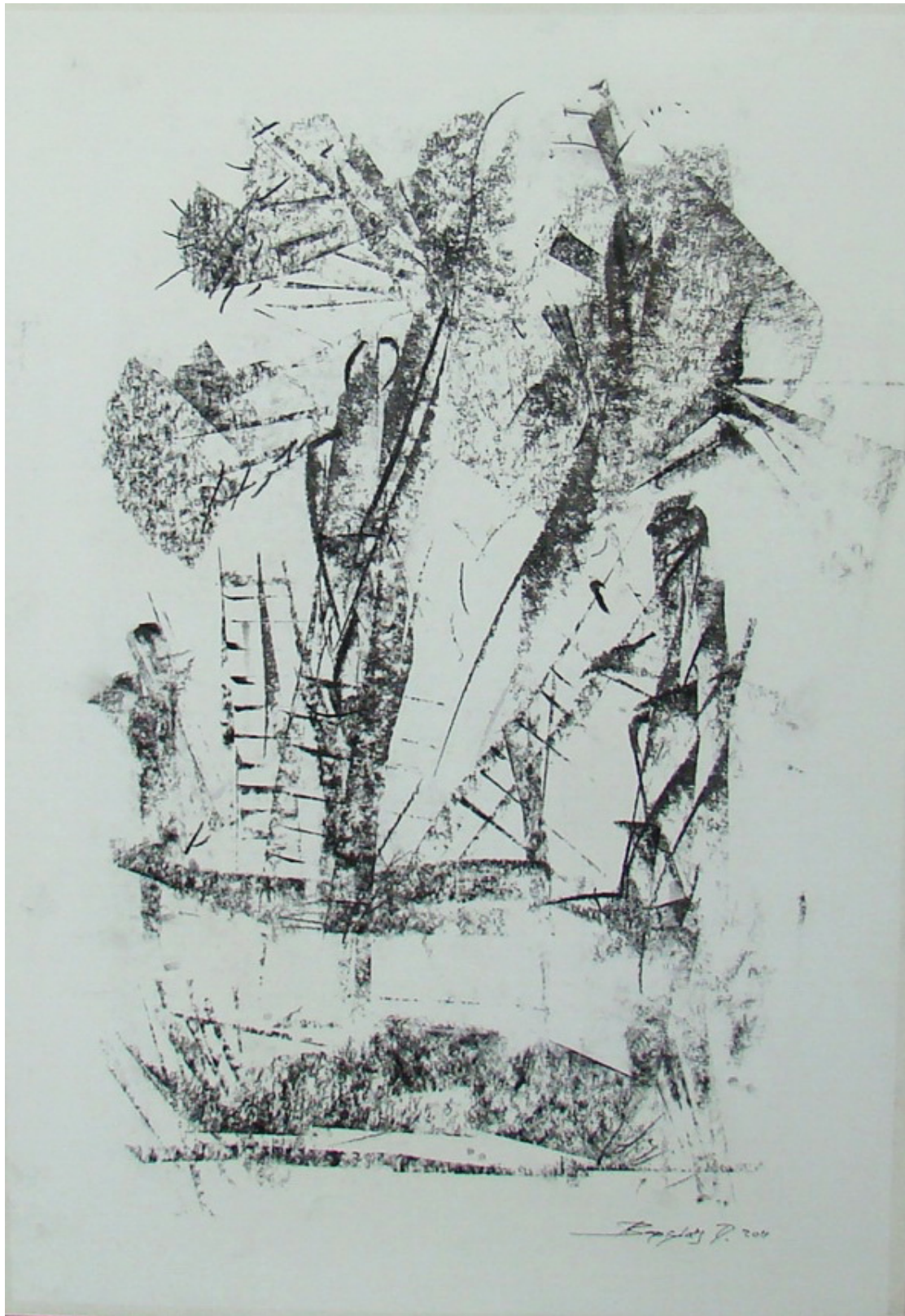
«Μάζεμα της ελιάς IV» 35cm X 50 cm, Ξηρό Παστέλ, 2013