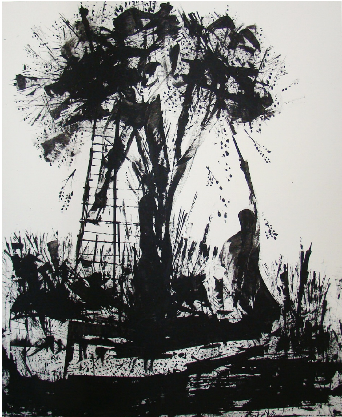
«Μάζεμα της ελιάς II» 90cm X 110 cm, Μεικτή τεχνική , 2013