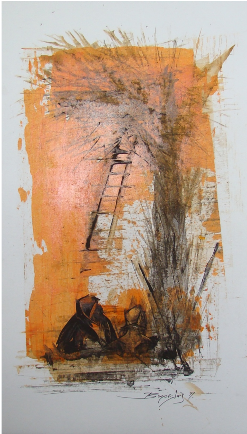
«Καμάρι» 25cm X 50 cm, Μεικτή τεχνική, 2013