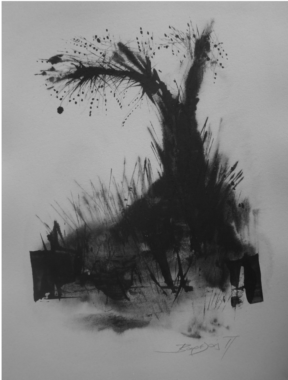
«Ελιά στο αγνάντι » 29cm X 43cm, Σινική 2015