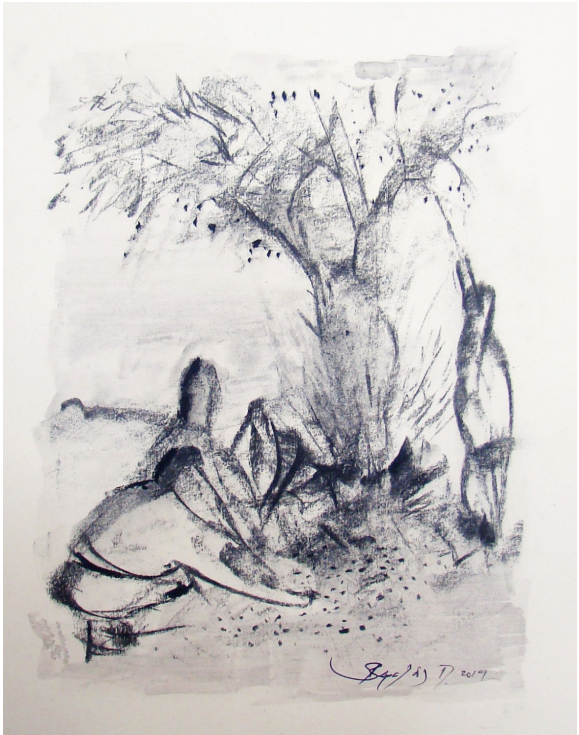
«Από κάτω» 29cm X 43cm, Ξηρό παστέλ, 2015