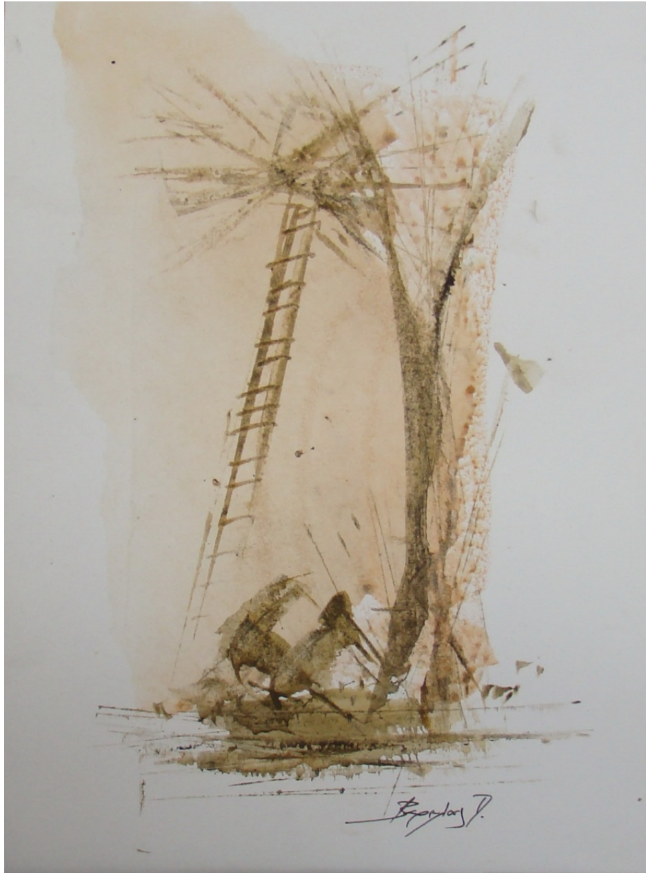
«Γυναίκες στις ελιές» 15cm X 25 cm, Μεικτή τεχνική, 2013