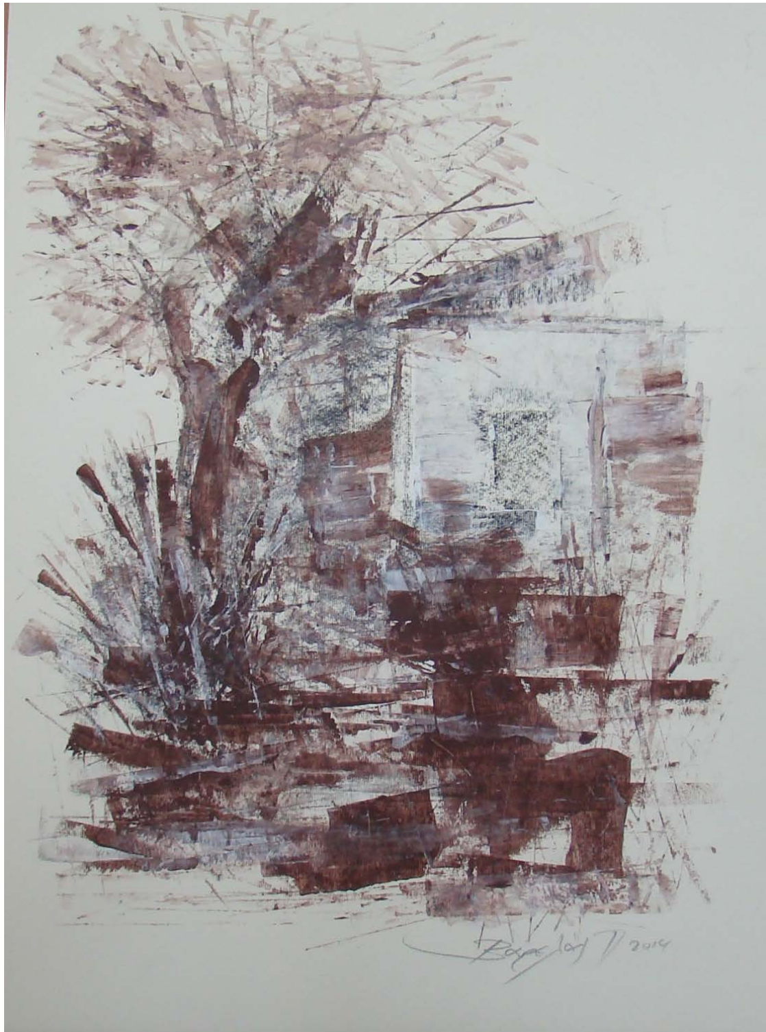
«Ελιά σε αγροτόσπιτο» 35cm X 50 cm, Μεικτή τεχνική, 2013