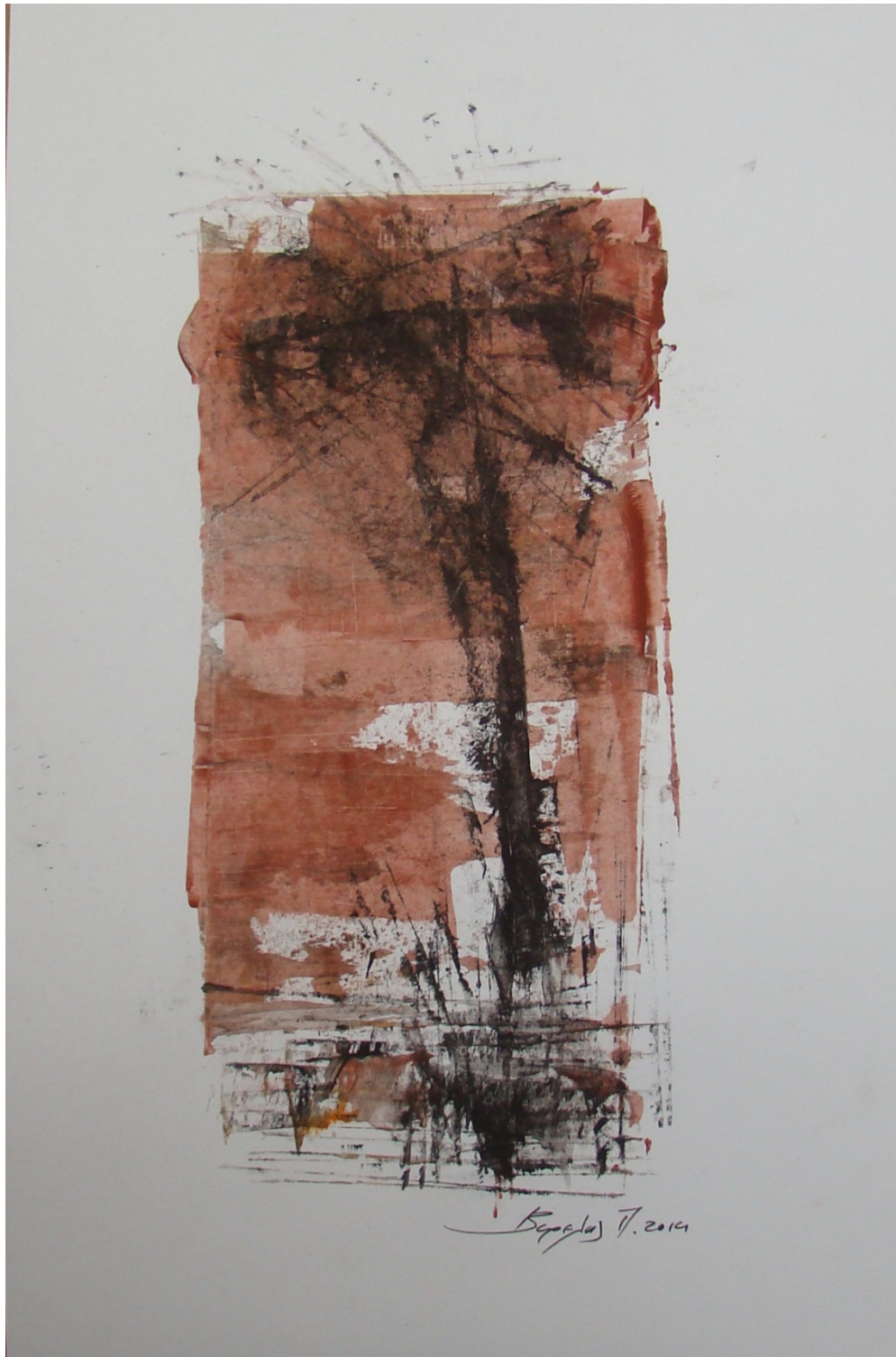
«Κοκκινόγια IV» 25cm X 35 cm, Μεικτή τεχνική, 2013