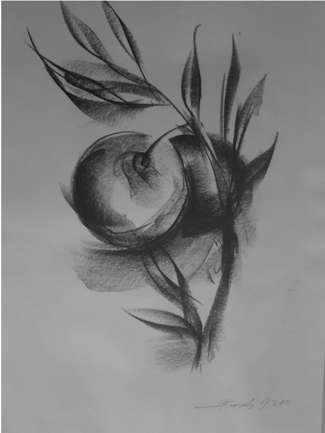
«Δικαρπος ελαία » 29cm X 43cm, Ξηρό παστέλ, 2015