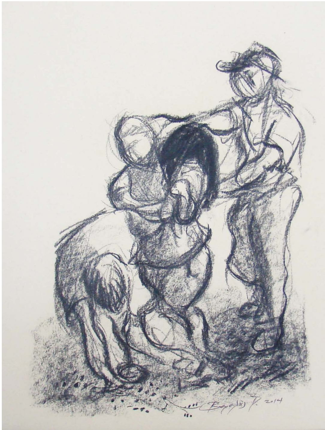
«Στη σκάλα I» 29cm X 43cm, Ξηρό παστέλ, 2014