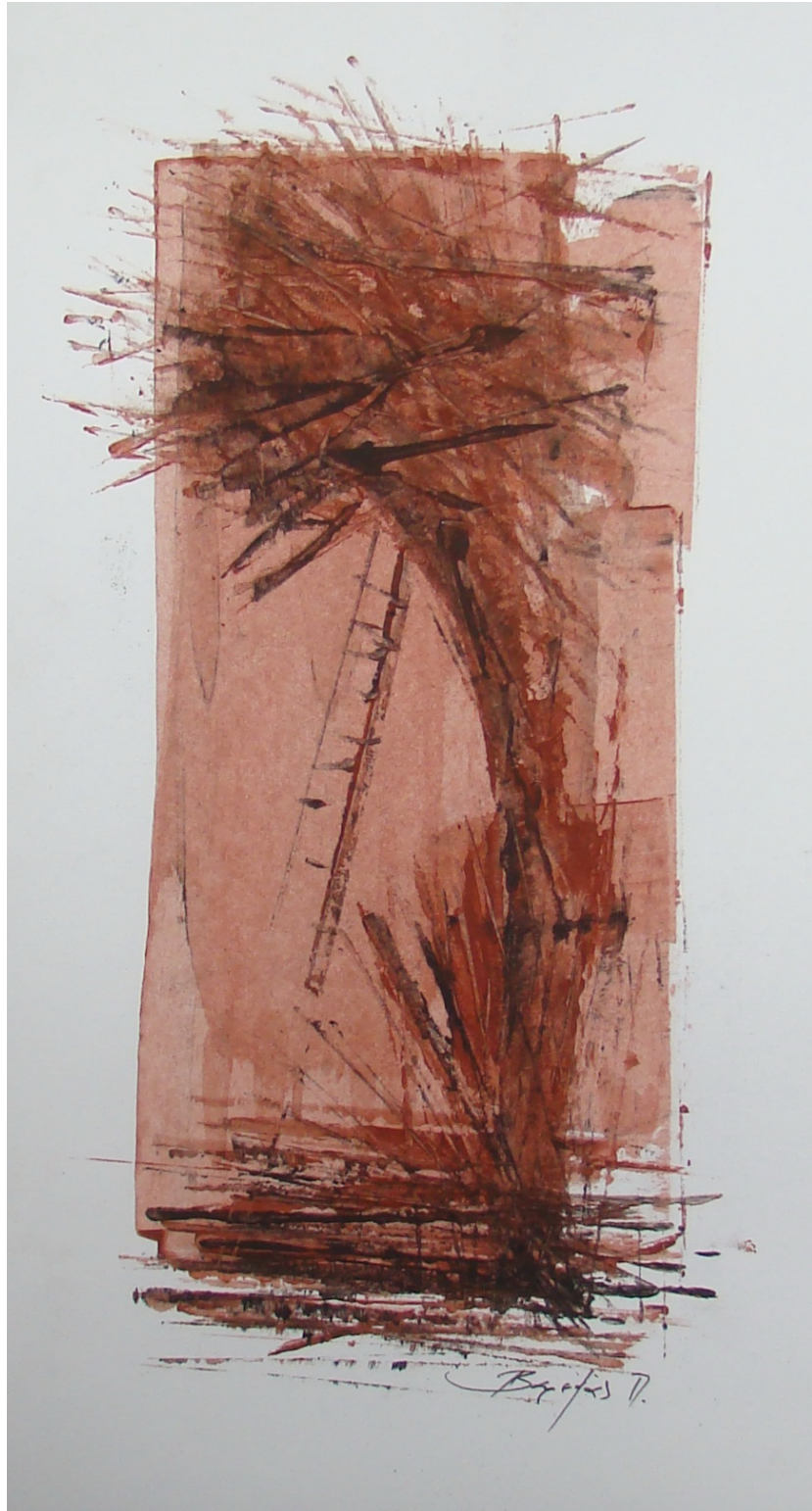
«Κοκκινόγια II» 25cm X 45 cm, Μεικτή τεχνική, 2013