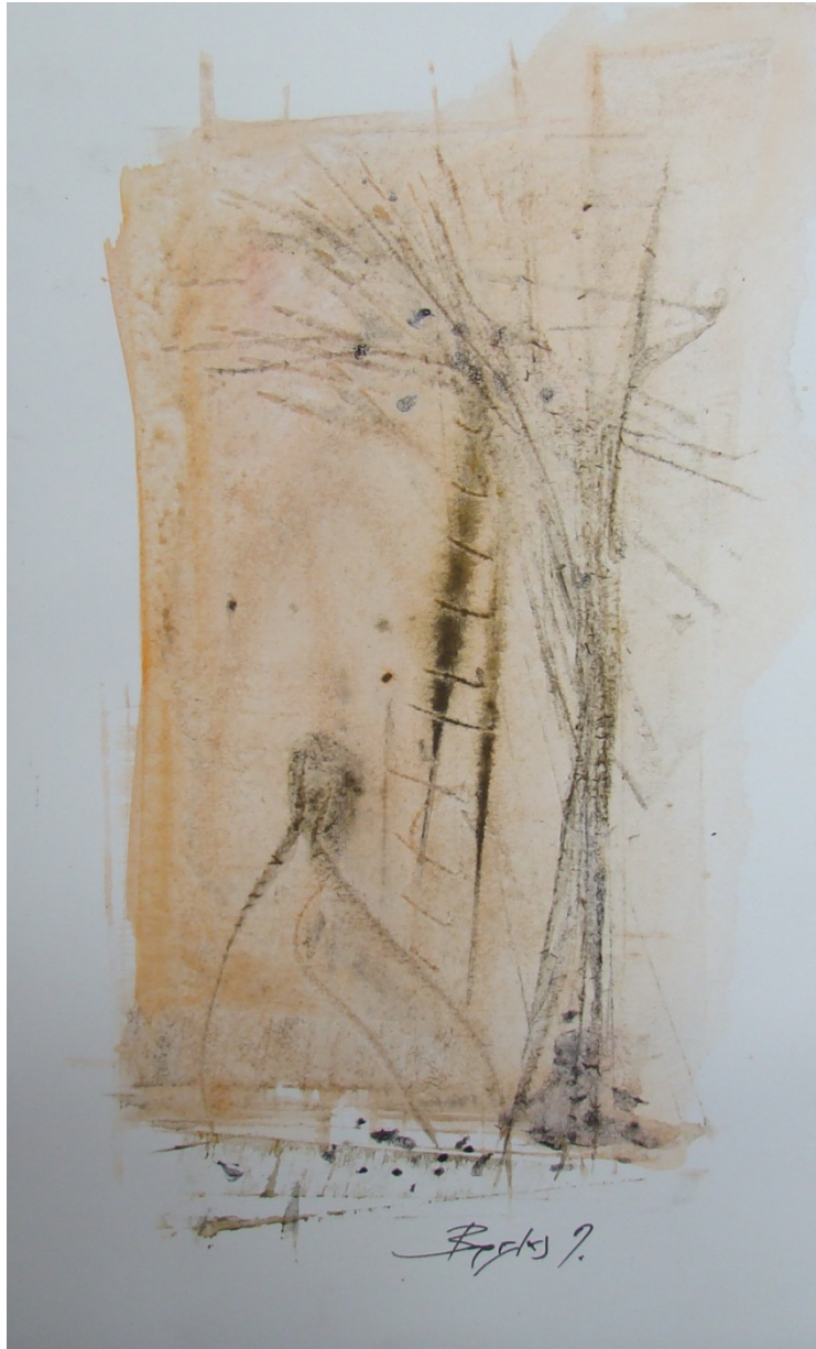
«Μόνη και έρημη III» 15cm X 25 cm, Μεικτή τεχνική, 2013