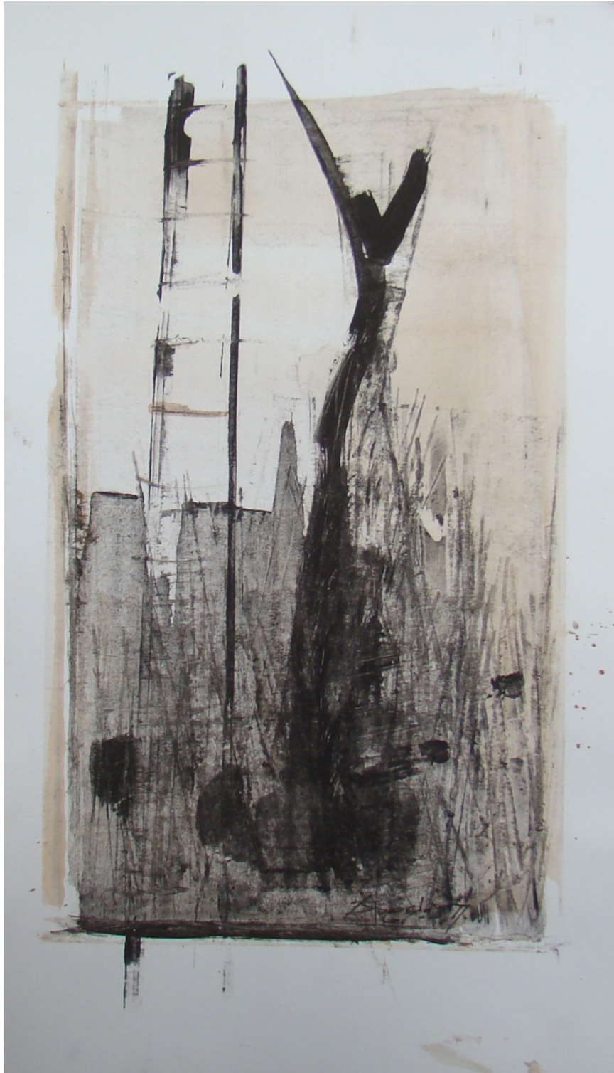
«Διαλογος» 25cm X 50 cm, Μεικτή τεχνική, 2013