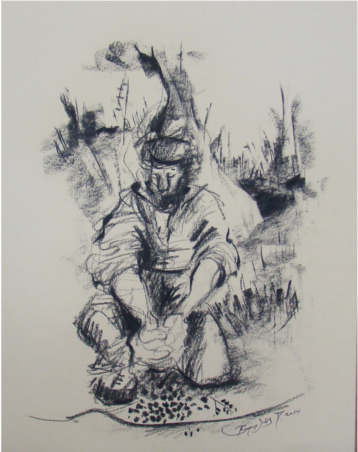
«Χαμμαδες III » 29cm X 43cm, Ξηρό παστέλ, 2015