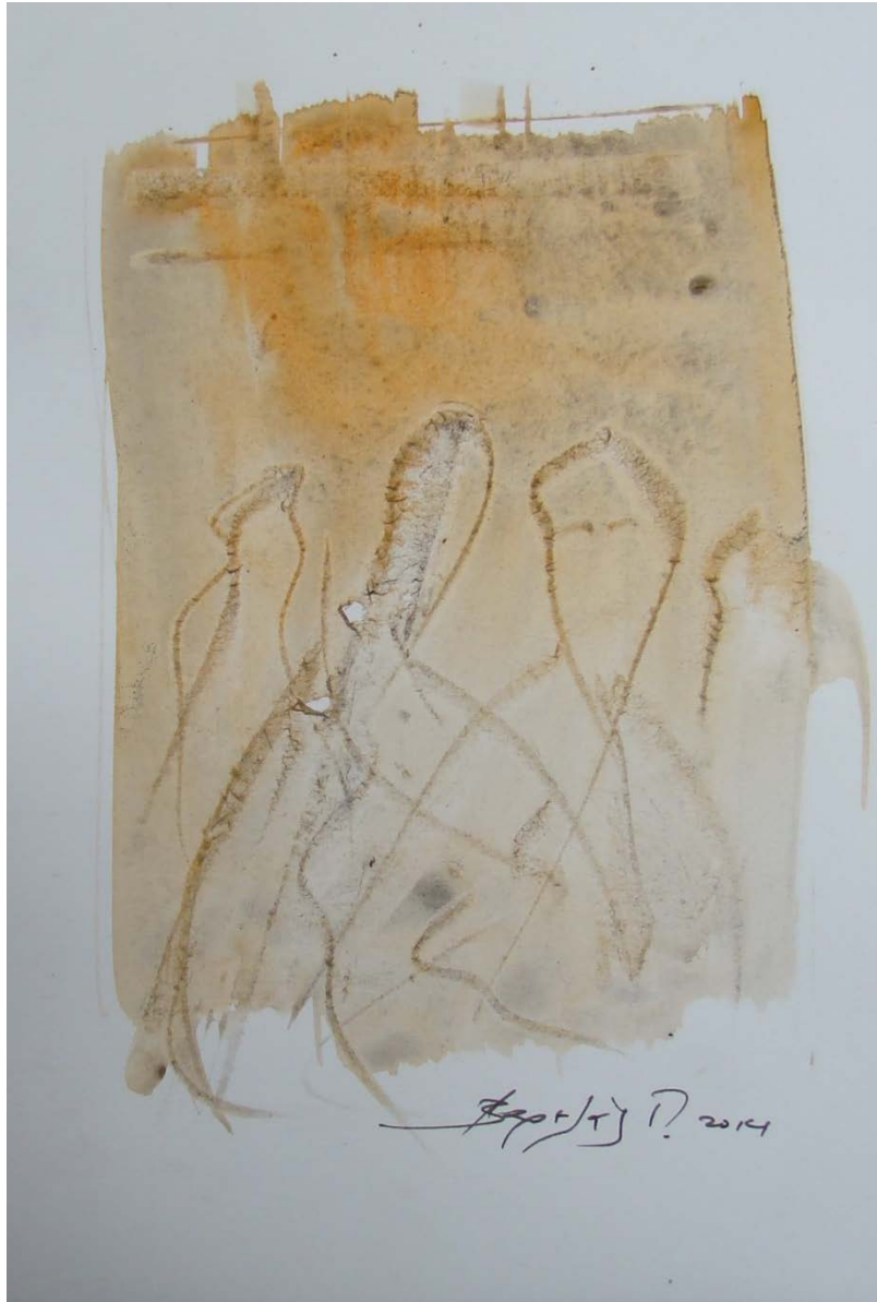
«Γυναίκες II» 15cm X 25 cm, Μεικτή τεχνική, 2013