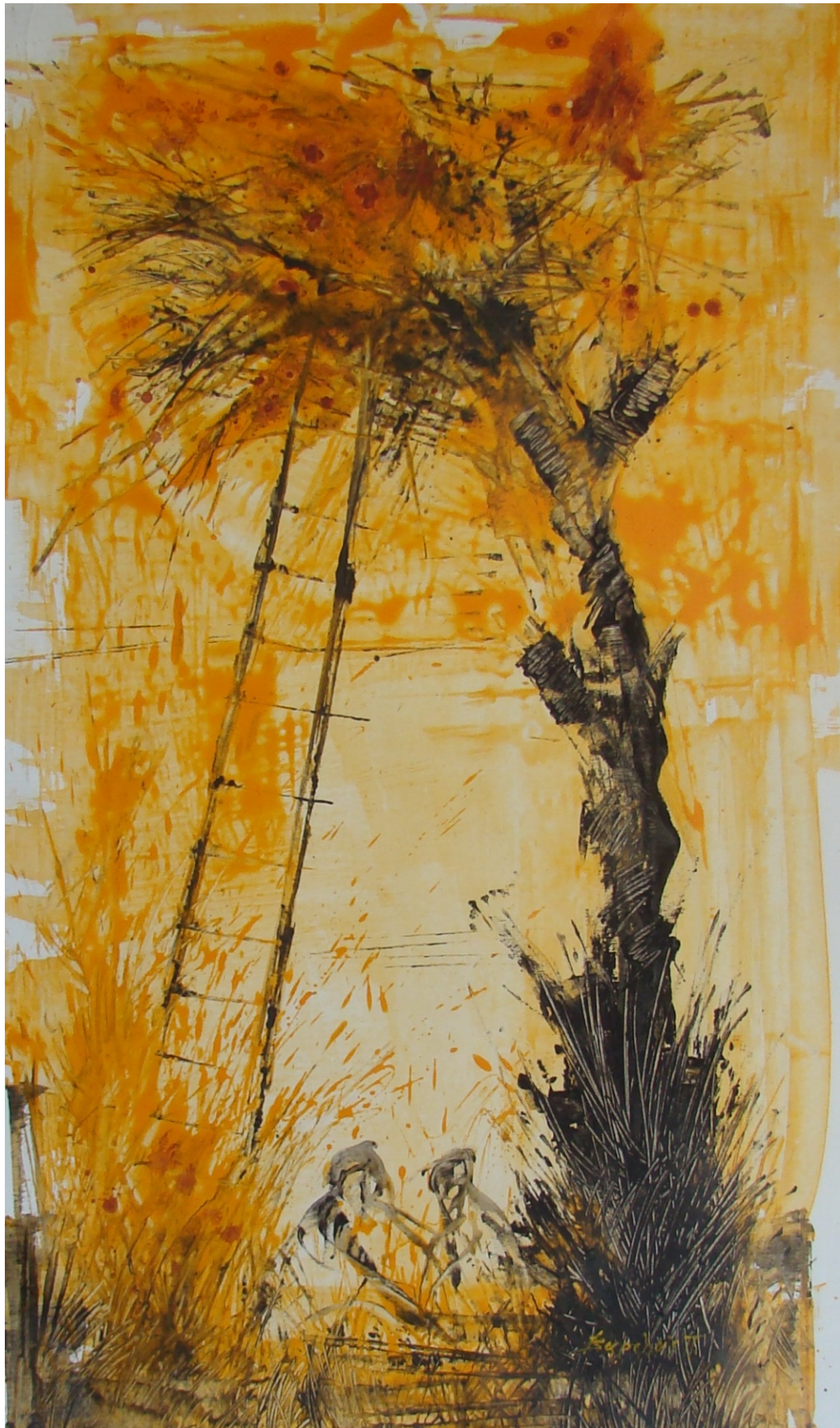
«Στη σκάλα III» 90cm X 43cm, Ακρυλικό, 2017