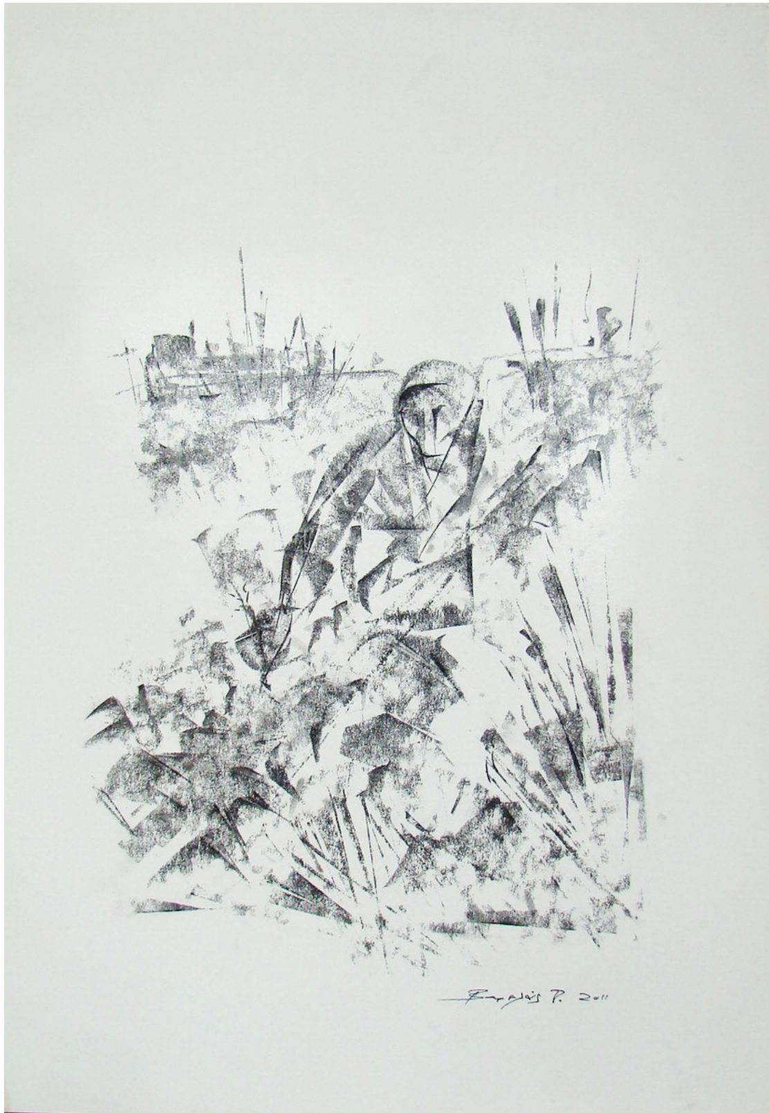
«Η σπορά» 35cm X 50 cm, Ξηρό Παστέλ, 2013