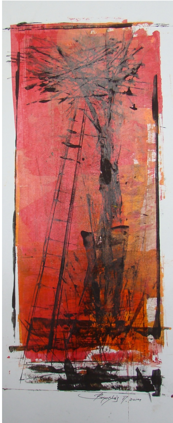
«Κοκκινόγια III» 25cm X 35 cm, Μεικτή τεχνική, 2013