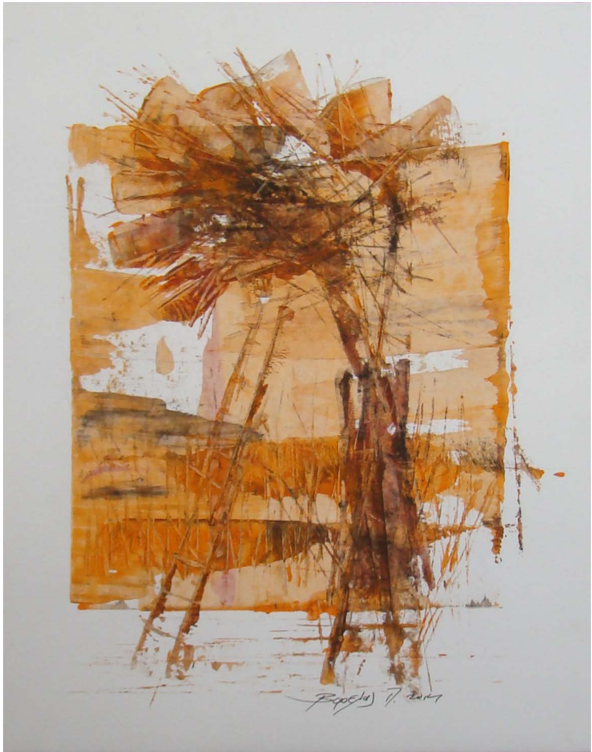
«Κοκκινόγια» 35cm X 50 cm, Μεικτή τεχνική, 2013