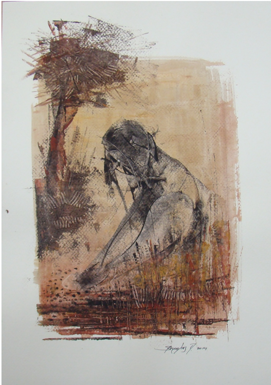
«Μόνη και έρημη II» 25cm X 35 cm, Μεικτή τεχνική, 2013