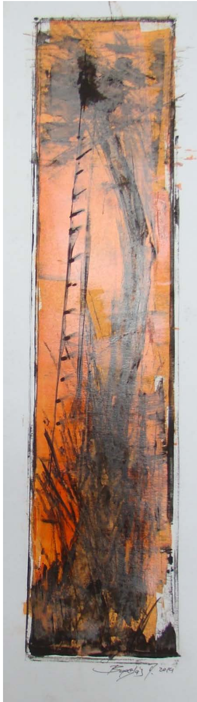
«Κιάφα» 55cm X 50 cm, Μεικτή τεχνική, 2013