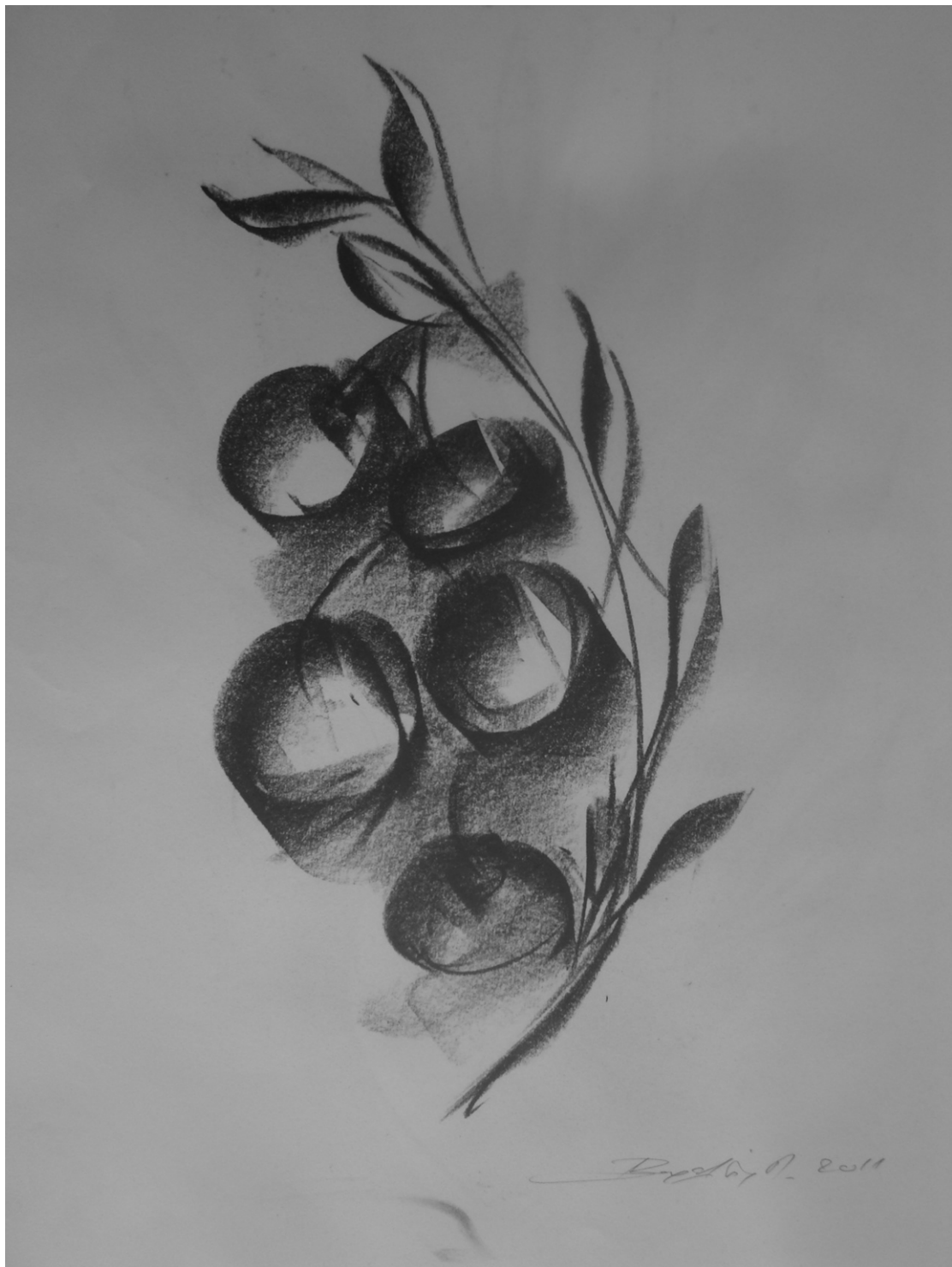
«Φορτωμένες και εφέτος » 29cm X 43cm, Ξηρό παστέλ, 2015