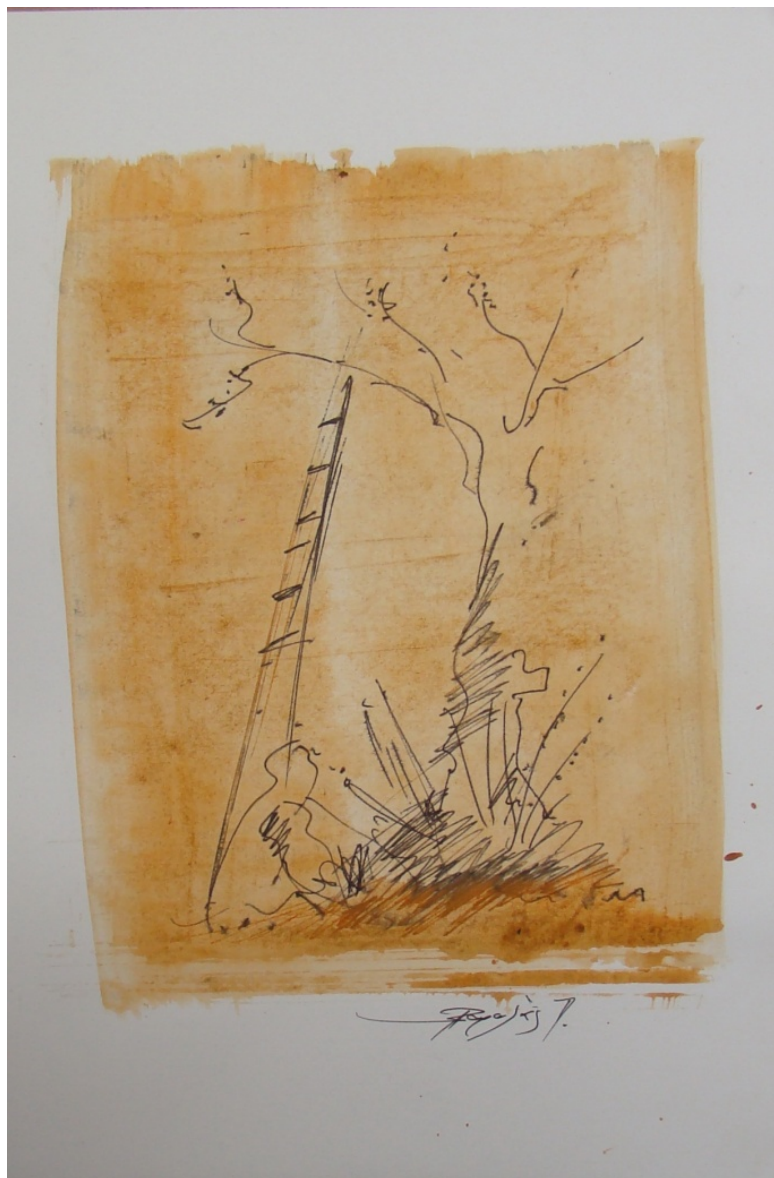
«Ελιά Γραμμένη» 35cm X 50 cm, Μεικτή τεχνική, 2013