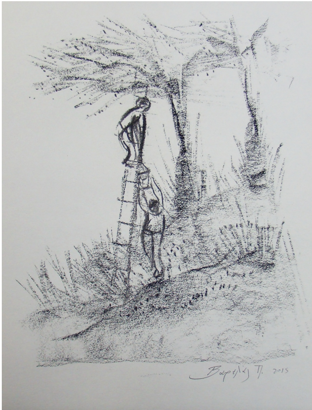
«Στη σκάλα Ι » 29cm X 43cm, Ξηρό παστέλ, 2015