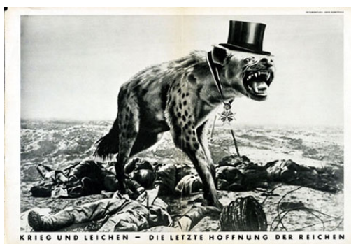
War and Corpses: The Last Hope of the Rich, John Heartfield (German, 1891-1968) - ALC, 11/18 (April 24, 1932)

Αυτή η γνωσιοθεωρητική εκγύμναση των θεατών έχει να κάνει με τη διαμόρφωση μιας νέας αισθητηριακής αντίληψης της πραγματικότητας, που αποσκοπεί στην εξάσκηση και αντιμετώπιση των πολυσύνθετων και πρωτόγνωρων καταστάσεων. Αλλωστε ό ίδιος πιστεύει ότι η τέχνη δεν είναι ένας τόπος μακαριότητας, ούτε για τους καλλιτέχνες ούτε για τους θεατές. Αντίθετα, είναι ένας τόπος παρουσίασης ιδεών, κοινωνικών καταστάσεων και συμπεριφορών. Γι' αυτό ακριβώς πρέπει «σαν φακός να μεγεθύνει» , να αντανακλά την ιδεολογική διαπάλη που συντελείται.